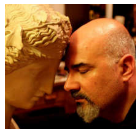
Rubrica a cura del dott. Alessandro Spampinato Psicologo e cantautore

di aprire gli occhi sulla Verità che è dentro di noi e che, se scoperta, ci rende liberi dalle catene della falsa cultura e delle false ideologie. La Realizzazione si raggiunge volgendo lo sguardo al proprio profondo per conoscerlo e questo viaggio richiede silenzio e introspezione. Chiudo questa riflessione con una famosa frase di Carl Gustav Jung: "Non c'è presa di coscienza senza sofferenza. In tutto il mondo la gente arriva ai limiti dell'assurdo per evitare di confrontarsi con la propria anima. Non si raggiunge l'illuminazione immaginando figure di luce, ma portando alla coscienza l'oscurità interiore. Chi guarda fuori sogna, chi guarda dentro si sveglia".