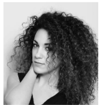
Rubrica di attualità a cura di Giovanna Montano