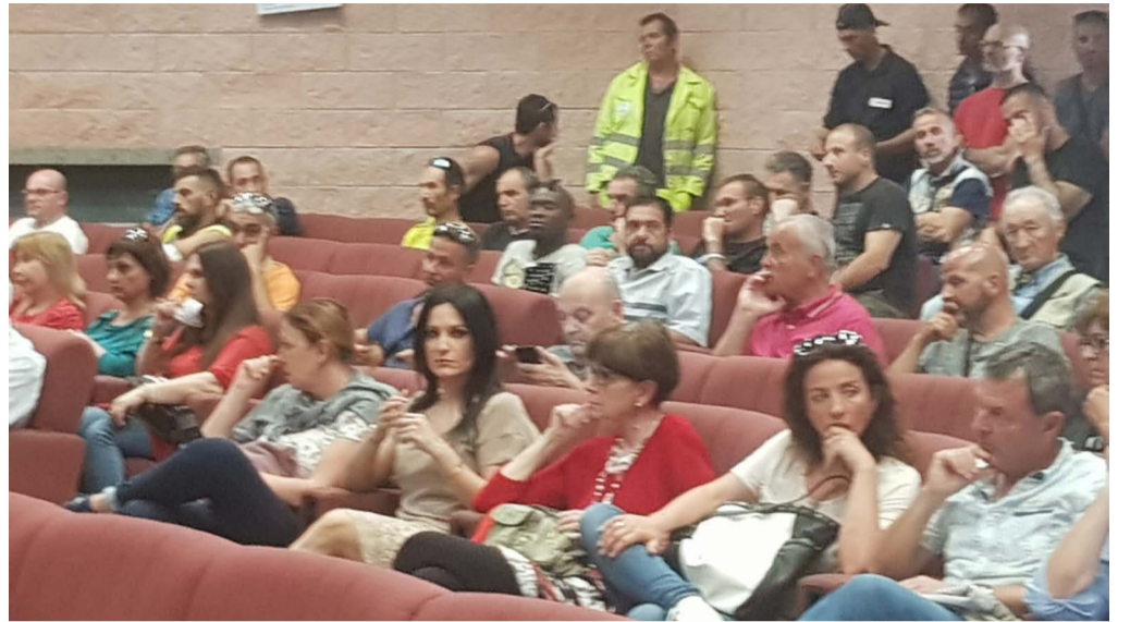
Dipendenti Csp tra il pubblico; sotto, il sindaco

L i chiamano servizi pubblici. Ma sono soprattutto il certificato di "qualità" di una amministrazione. Ebbene, a stare a ciò che avviene a Civitavecchia, i risultati sono presto detti. Basterebbe soffermarsi, anche un attimo solo, sulla raccolta dei rifiuti, con i nauseabondi traboccamenti dai cassonetti, in attesa per giorni prima di essere svuotati, con ciò che ne consegue per vista e olfatto dei contribuenti.