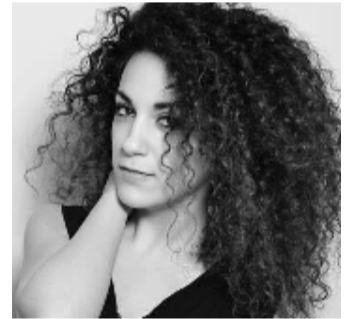
Rubrica di attualità a cura di Giovanna Montano

le la fronte. Quello di Beyoncé al Coachella è sicuramente stato il momento culminante, l'apoteosi del successo di questo anno. Tuttavia non è stato l'unico rilevante: hanno cantato e si sono infatti visti alcuni dei musicisti più significativi e alla moda del momento e non solo: The Weeknd, St Vincent, SZA, David Byrne, Rihanna e Nile Rodgers.