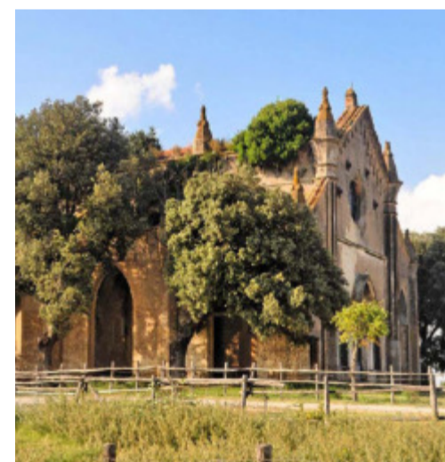
rismo tenuta La Farnesiana, Borgo della Farnesiana, Via Farnesiana snc, Allumiere (RM).

con la Soprintendenza Archeologia, Belle Arti e Paesaggio per l'area metropolitana di Roma, la provincia di Viterbo e l'Etruria Meridionale”. Date turni del Campo dei Monti della Tolfa: il primo turno dal 30 luglio al 12 agosto mentre il secondo turno dal 13 al 26 agosto 2018. La quota individuale di partecipazione per il turno intero (due settimane) è di 405 euro mentre per la settimana singola è di 280. Sede: Agritu-