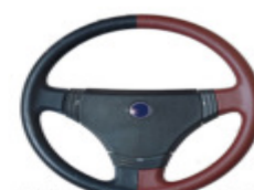
PRIMA DOPO ANCHE PER VOLANTI