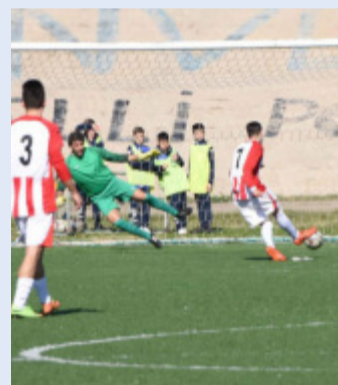
Il rigore di Molfesi