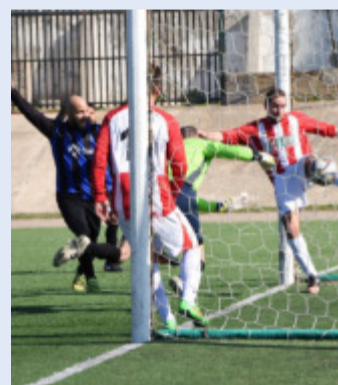
L'autorete di Baroncini

ELEZIONI DEL CONSIGLIO REGIONALE 4 MARZO 2018