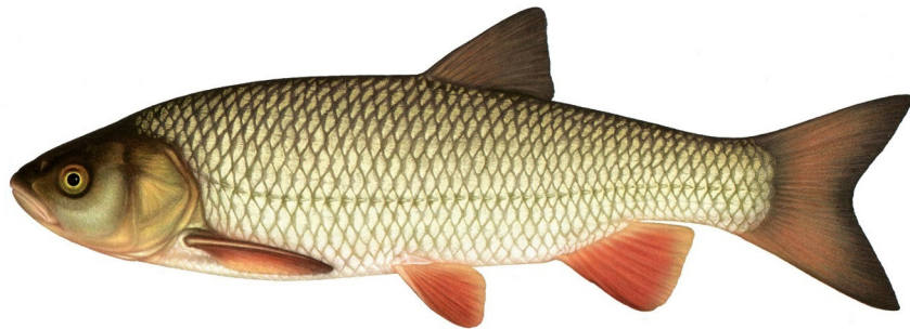
Färna, Squalius cephalus