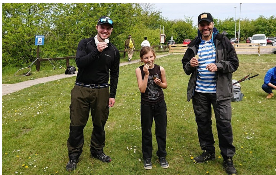
Pristagarna vid KM i spinnfiske i Sallerupsdammen.