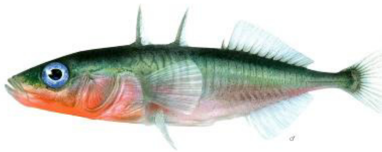
Storspigg, Gasterosteus aculeatus