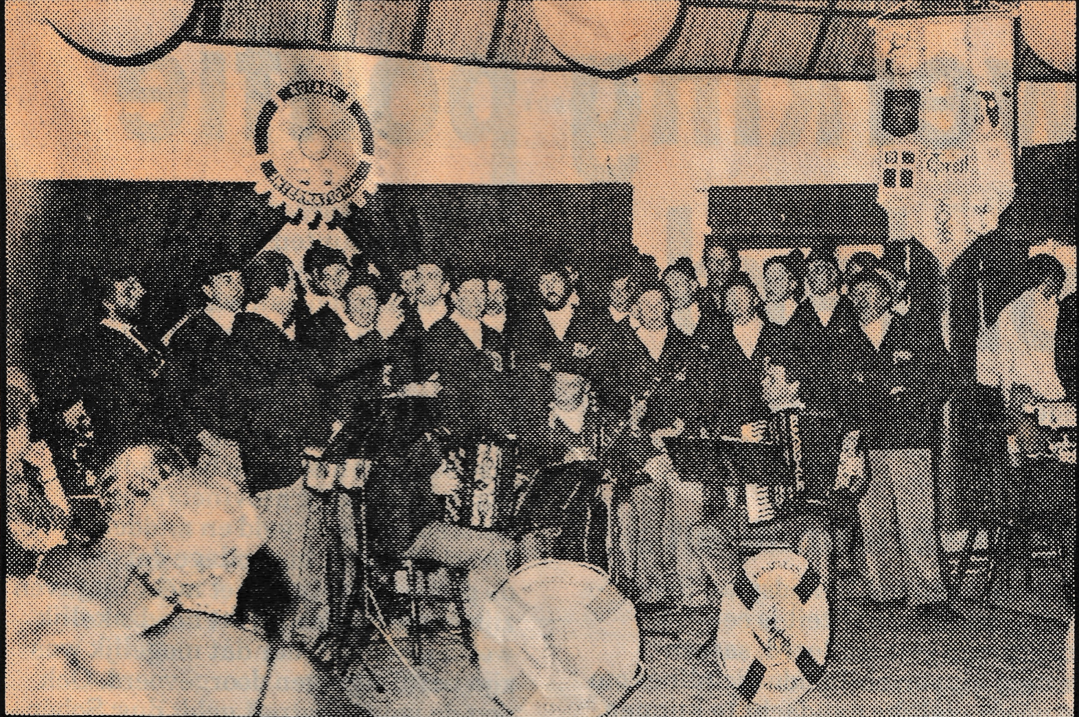
● De Magellan Singers. 1906