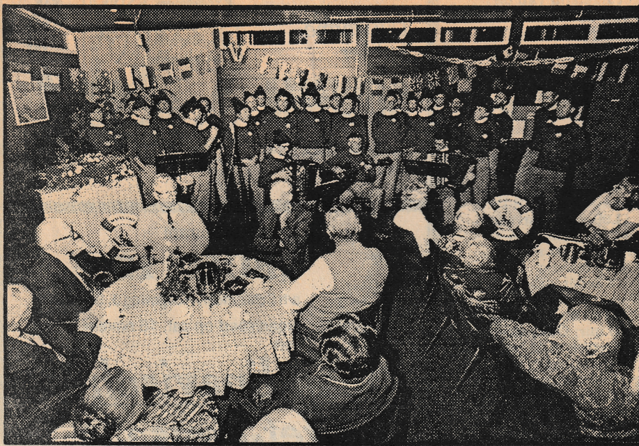
● De bewoners van Damsterheerd luisteren naar de 'Magellan Singers' uit Delfzijl.