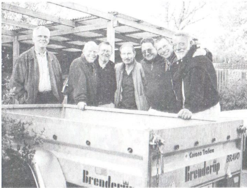
Nørrevej har sit eget „lille“ trailerlaug

Jeg har hørt i området at man ikke var så glad for smagen af kommunens „kildevand“, men jeg synes nu heller ikke man skal byde sin whisky hvad som helst.