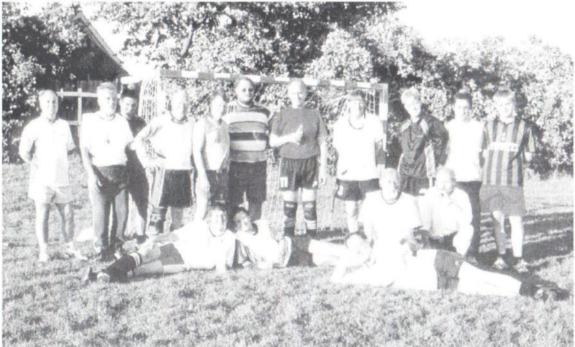
Aktive fodboldudøvere ved en tepause.

I dette nummer lidt om sommeren, vandværket, vejene og om fodbold