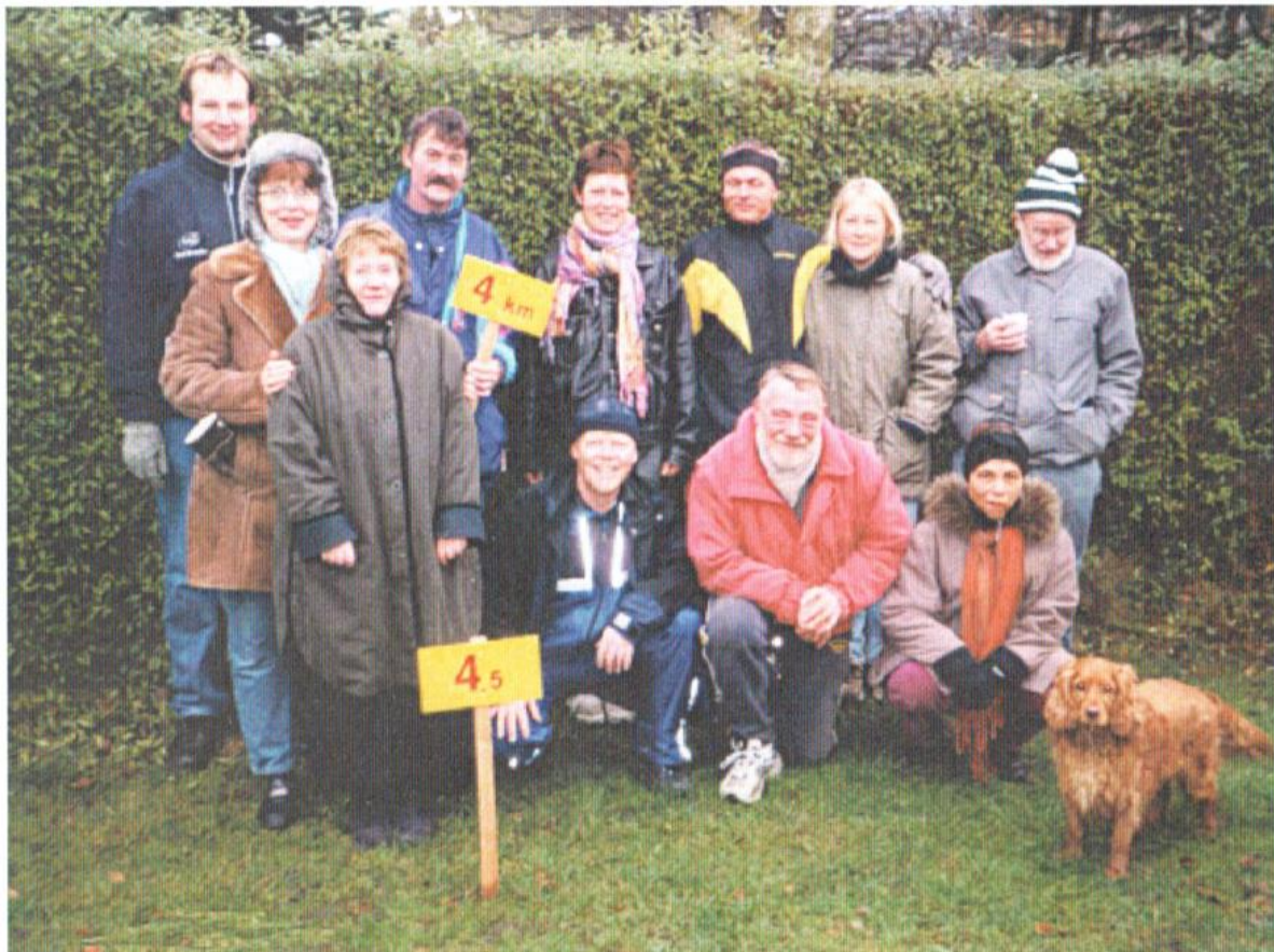
Her ses de gæve juleløbsdeltagere fra 2001

Sikke-no'et, de løber til jul, jeg tror jeg nøjes med at løbe regnskaberne i gennem. Jeg må jo også lige se om jeg stadig ikke er nogen belastning på budgettet.