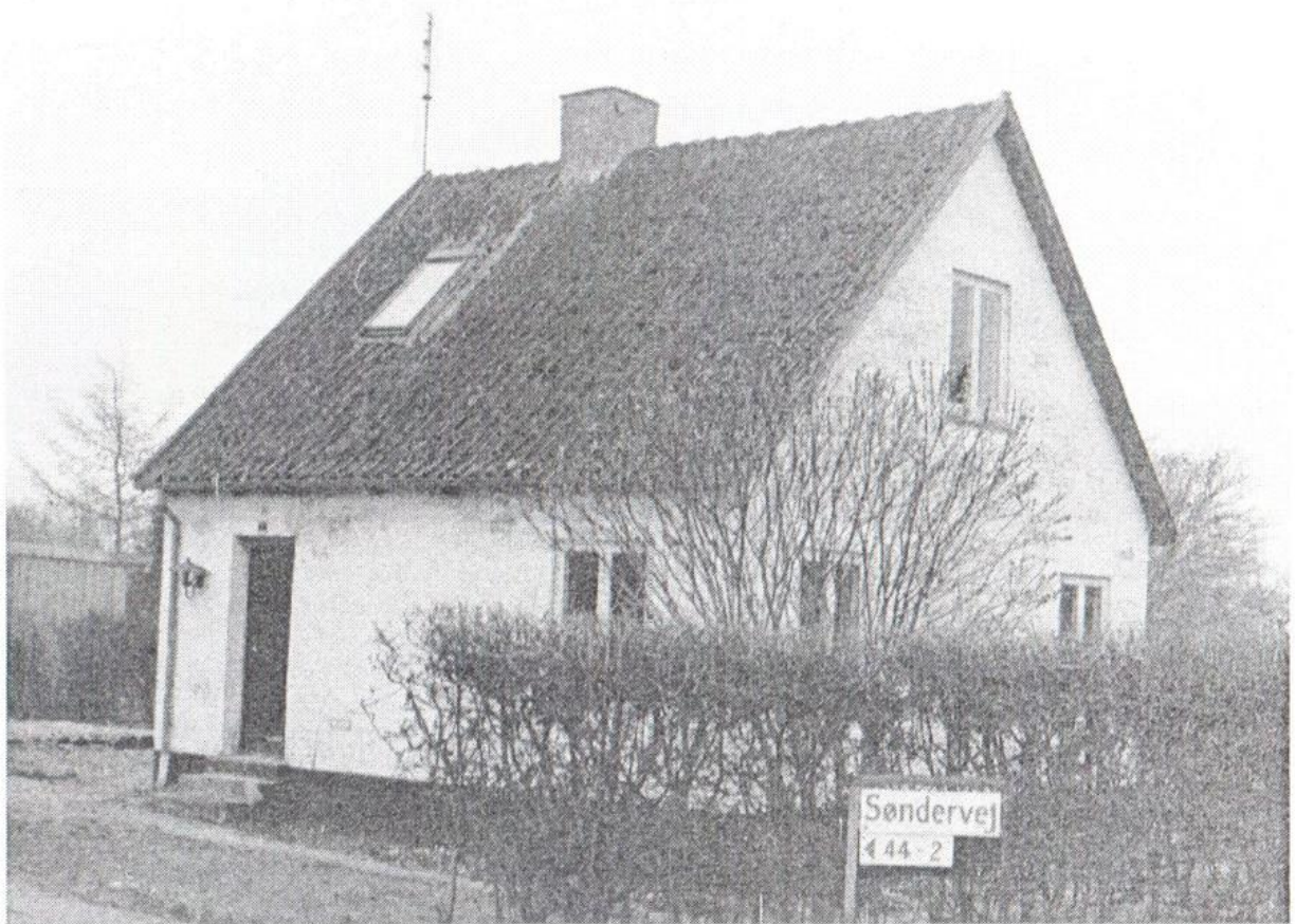
Søndervej 2 FØR det blev bygget om

I dette nummer om vandværket, vejudvalg og deltag IGEN i den store konkurrence