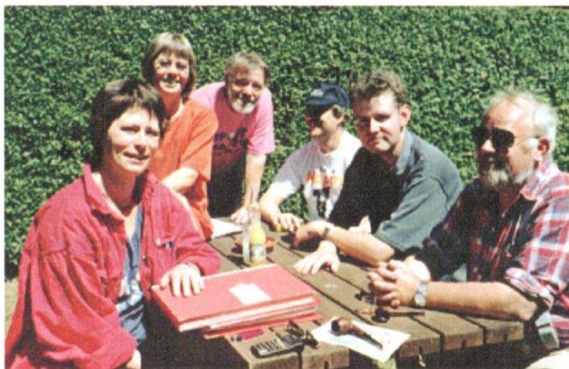
Måløvhøjs bestyrelse 1998