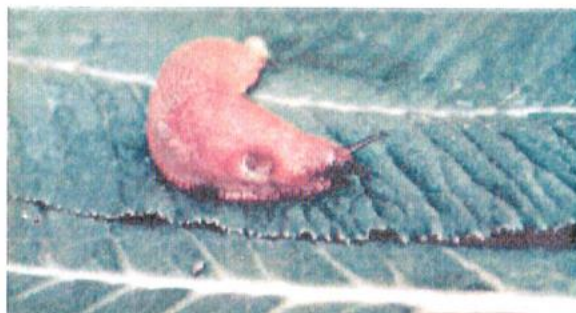
En dræbersnegl på vej til Måløvhøj?

N.B. Hold øje med dræbersneglen, det forlyder at den er set på Måløvhøj.