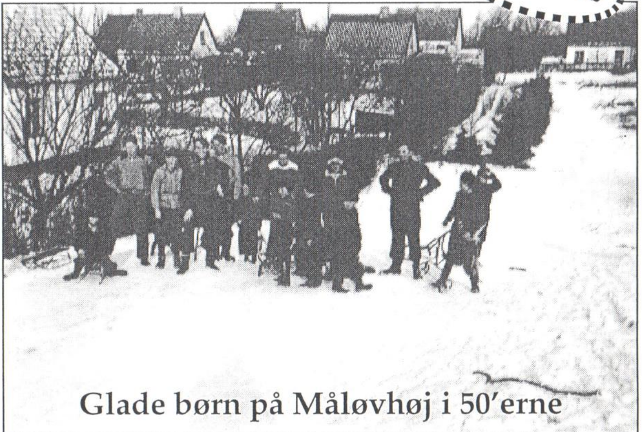
Glade børn på Måløvhøj i 50'erne