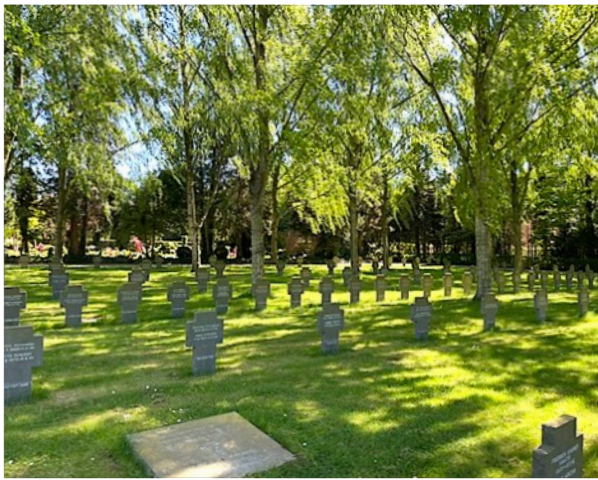
Gravene fra krigens tid