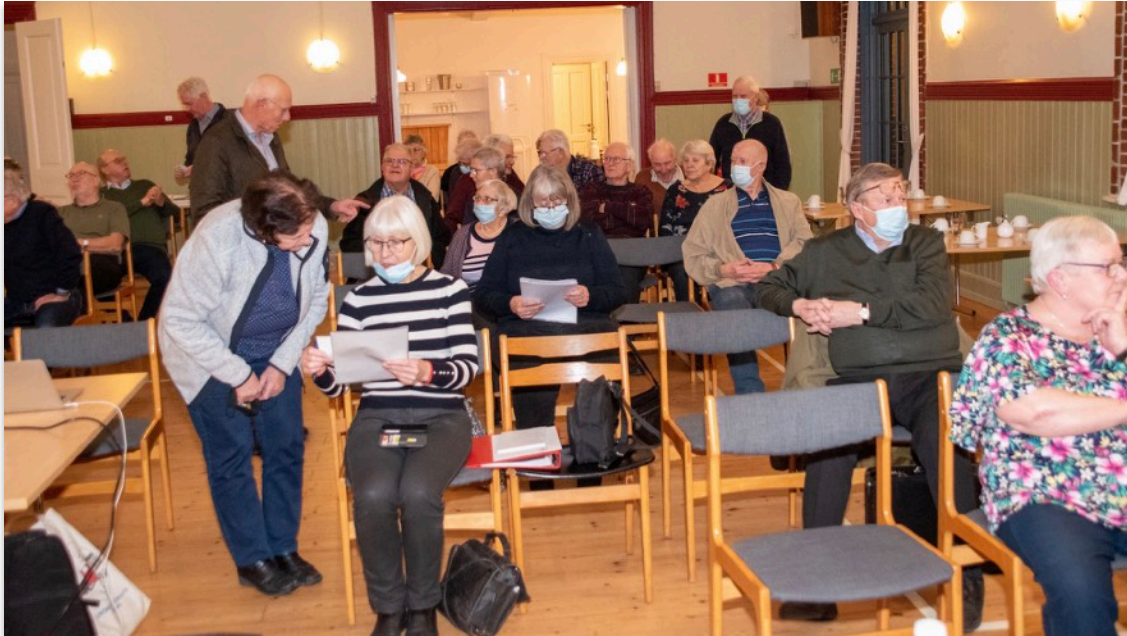
Mødedeltagere ved at tage plads.