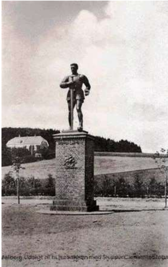
Skipperens Erindringsværksted Gundorflund 32 9000 Aalborg