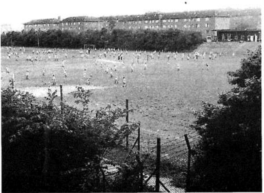
Aab's anlæg på Ny Kærvej, der i omkring 35 år var rammen om et frodigt klubliv og talrige minderværdige kampe.

Aab's anlæg med Gundorflund i baggrunden. Set fra viadukten Ny Kærvej.