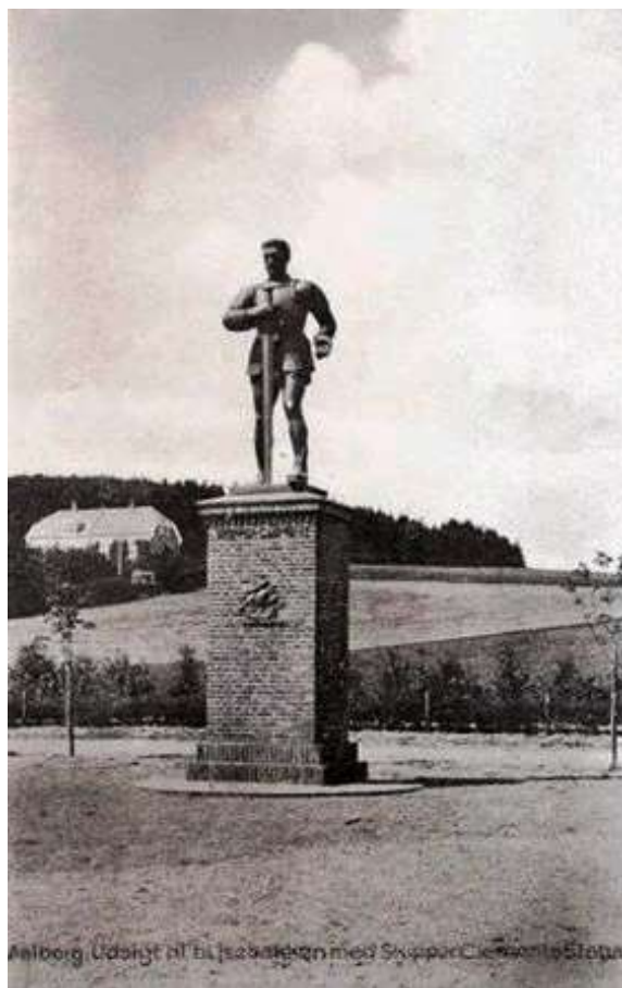
Skipperens Erindringsværksted Gundorflund 32 9000 Aalborg