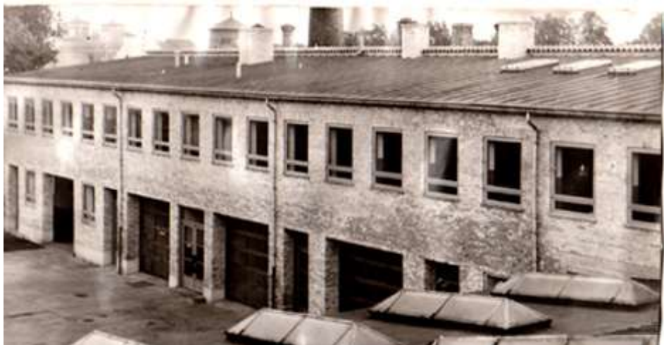
Sidebygning bag ved værkstedet der indeholder pladeværksted, omklædningsrum, frokoststue, el. værksted samt renserum.

Vi lærlinge blev en gang om året sendt op på taget, for at rense tagrenderne.