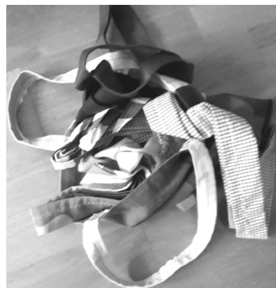
"Herrband" bärs över axeln av de damer som, liksom herrarna, är vänsterdansare.

På varje kursställe finns alltid en bag eller väska med nödvändig utrustning, bl a herrband, handsprit, muggar och pennor m m.