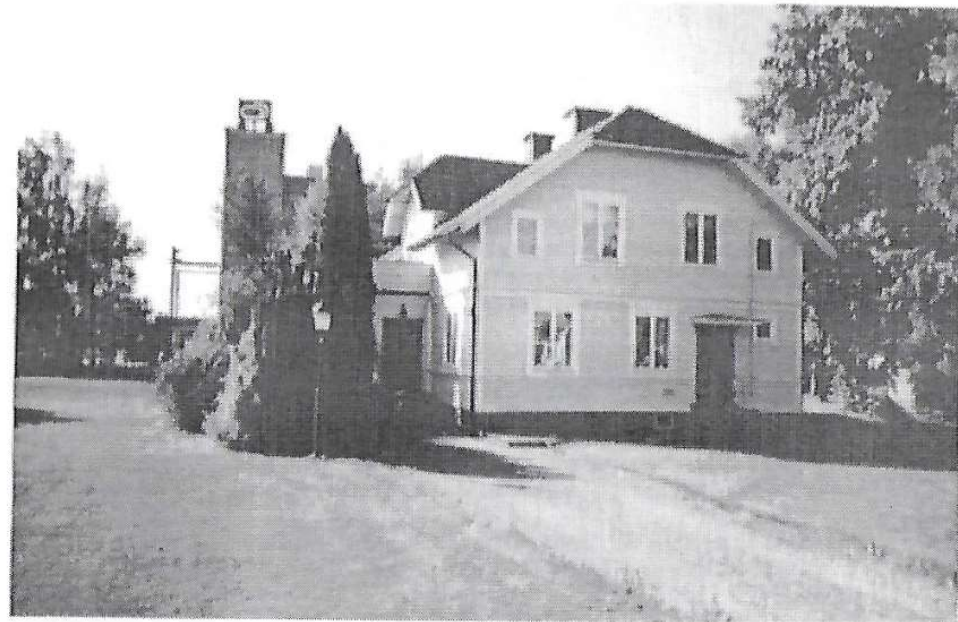
Götene Motorklubbs klubblokal på Järnvägsgatan 8 i Götene.

Förare som önskar delta i andra serier/tävlingar än i punkt 3 angivna har möjlighet att ansöka om bidrag hos styrelsen. Varje ansökan kommer att särbehandlas.