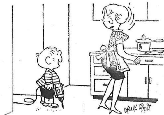
- Ska jag borra några hål i köket också, mamma?