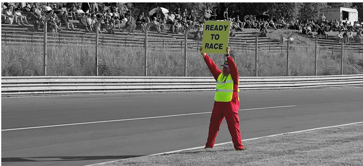
Sevärda race när Supercupsfinalen avgjordes på "ringen".