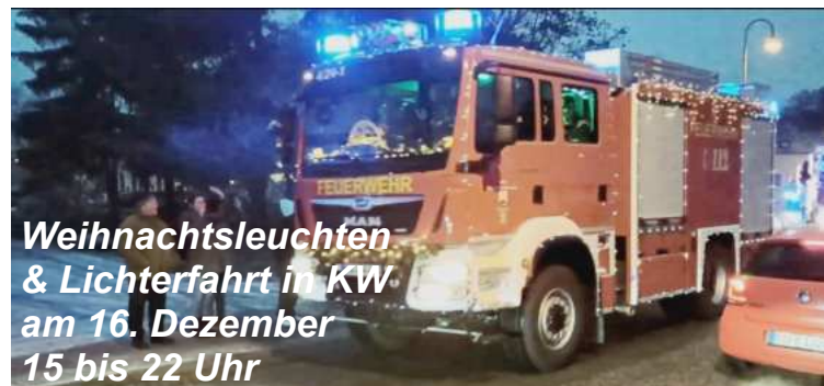
Weihnachtsleuchten & Lichterfahrt in KW am 16. Dezember 15 bis 22 Uhr

Impressum: Wernsdorfer Herausgeber: Heimatverein Wernsdorf-Ziegenhals e.V., www.wernsdorf.info Vorsitzender: Bodo Nitschke, Storkower Str. 3, 15713 Königs Wusterhausen Redaktion: Leitung & Anzeigen & Satz/Layout: Manfred Calvelage, Alte Dorfstr. 4, 15713 Königs Wusterhausen, (0 33 62) 57 99 905 | Email: mc@wernsdorf.info Mitarbeit: Corinna Calvelage (0 33 62) 57 99 905 Nächster Redaktionsschluss: 18.2.2024 Für den Inhalt der Artikel sind die Autoren verantwortlich.