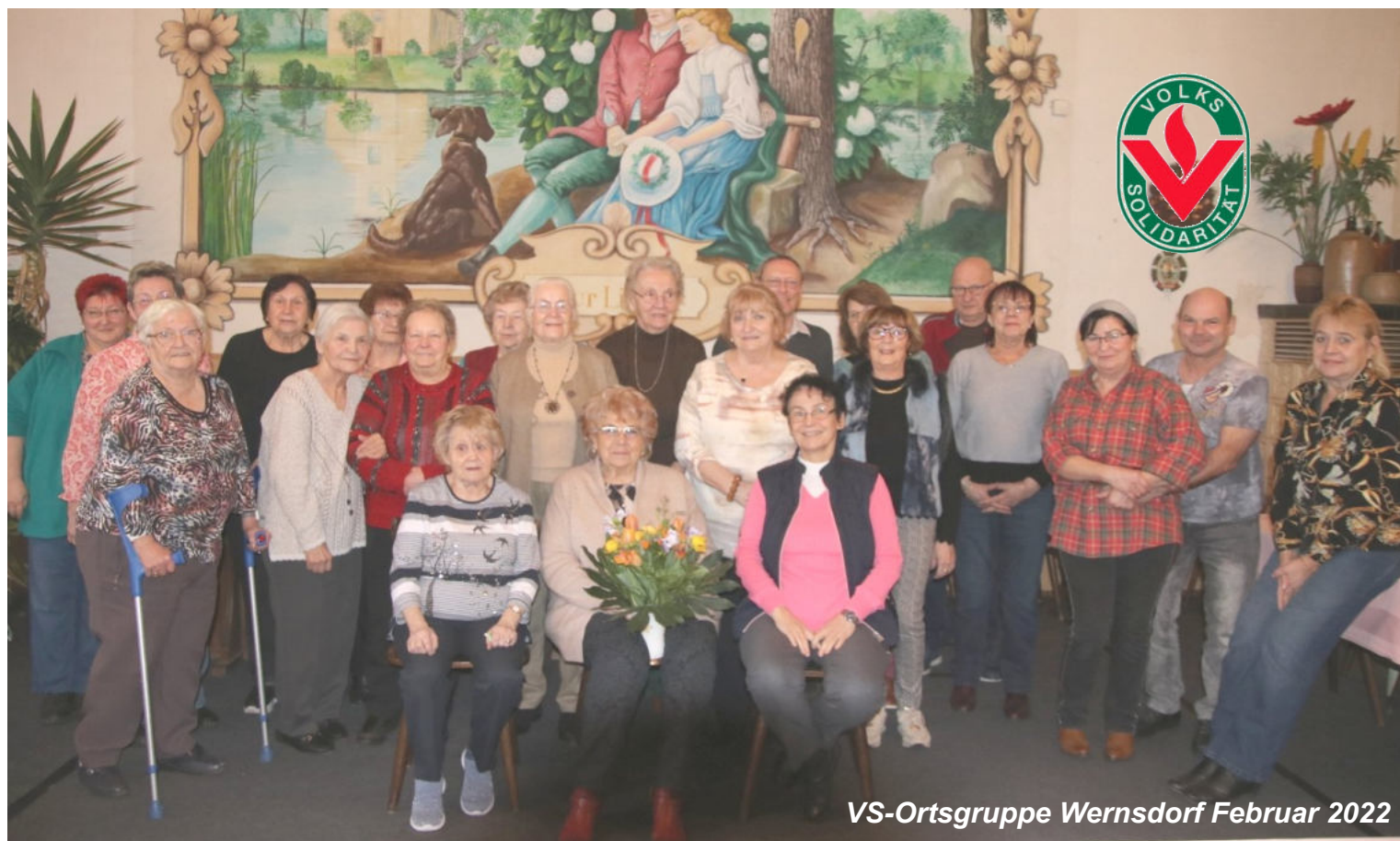
VS-Ortsgruppe Wernsdorf Februar 2022