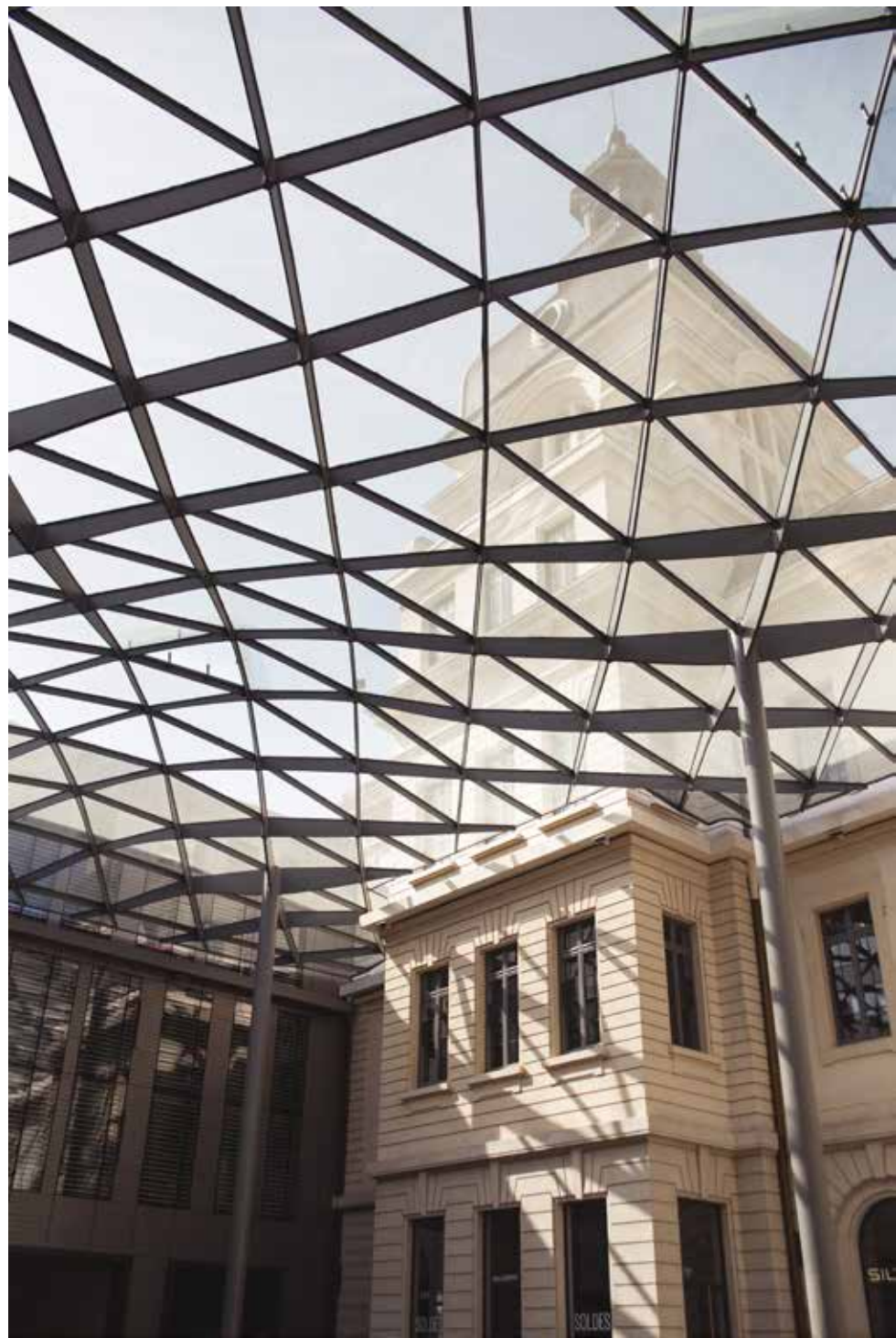
De koepel.