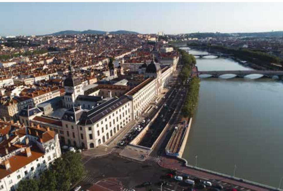
Het Hôtel-Dieu aan de Rhône.

Naast het InterContinental Lyon herbergt het nieuwe Grand Hôtel-Dieu winkels en restaurants, een congrescentrum, een privéparkeerplaats en de bovengenoem-