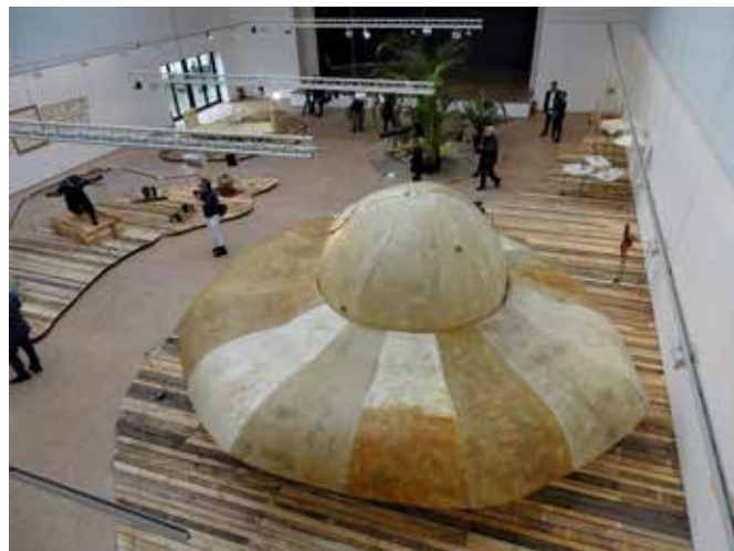
Bing of the Ferro Lusto (foto: R. Spatz).

Campo&Campo tot 22 maart 2020, Grote Steenweg 19-21 Antwerpen. Tijdens de tentoonstelling dagelijks open van 10.00 tot 18.00 uur. Tram 7 en 15 (vanaf Centraal Station) stoppen voor de deur (halte De Merode).