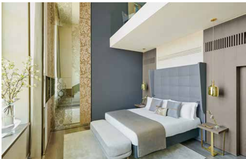
Boven: de Dôme Bar - Hôtel Intercontinental en detailfoto Dôme Bar en buitenzicht Hôtel Intercontinental. Onder: duplex Suite - Hôtel Intercontinental..

Het artikel "Hôtel Dieu" in deze DNT is één van 8 projecten die in eerste Archi-News 1/2020 Printed worden voorgesteld. Ieder lid van de VJV kan een gratis exemplaar van het Archi-News printed