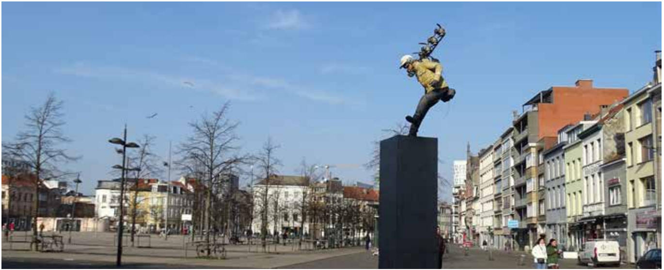
Pepto Bismo.

Zijn artiestennaam Panamarenko klinkt melodieuzer dan Henri Van Herwegen. De lettergrepen dansen door het luchtruim. Het is een verbastering van Panteleimon Ponomarenko, (Sovjet-politicus); een naam die de kunstenaar toevallig op de radio hoorde. De Antwerpse kunstenaar Panamarenko is vooral gekend voor zijn wonderlijke constructies van onderzeeërs, imaginaire voertuigen, machines en assemblages vaak gelinkt aan zijn fixatie om te vliegen. Het ontwerpen van draagbare hefschroefapparaten getuigen ervan. Ook de vleugelslag van insect en vogel fascineert hem. Telkens weer etaleert hij zijn verlangen om de zwaartekracht te overwinnen. Hij legt het uit in zijn boek The Mechanism of Gravity uit 1975. Overvliegende bommenwerpers in de Tweede Wereldoorlog deden hem in kinderlijke onschuld gebiologeerd naar de lucht turen. Als volwassene herinnert hij zich nog het geluid van de moordende V1-bommen boven de Scheldestad. De basis voor zijn interesse was gelegd.