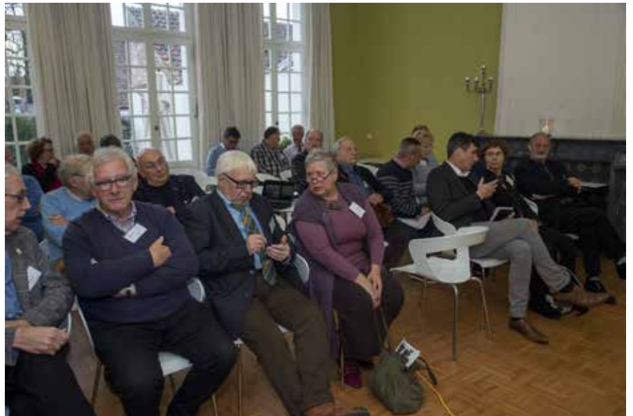
De deelnemers zitten klaar voor de infosessie over auteursrechten.

In de loop van het gesprek bleek dat mensen een verkeerd beeld hebben van wat ze mogen doen op Facebook. Dit medium lijkt vrij van rechten, maar niets is minder waar. Ook daar blijven auteursrecht en portretrecht van kracht. Dus niet onbezorgd en onbezonnen alles overnemen van een Facebook-account! De enige conclusie die we konden trekken, was dat de tijd veel te kort was voor