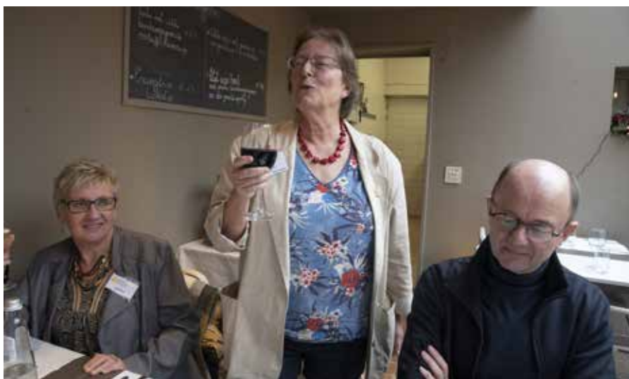
Enkele sfeerbeelden van de lunch.

met de rechten op je eigen foto's en op die van anderen die je wil gebruiken? Mag je zomaar mensen herkenbaar op je foto zetten? Mag je iemand ridiculiseren in je cartoon? Mag iemand jouw tekst gebruik-