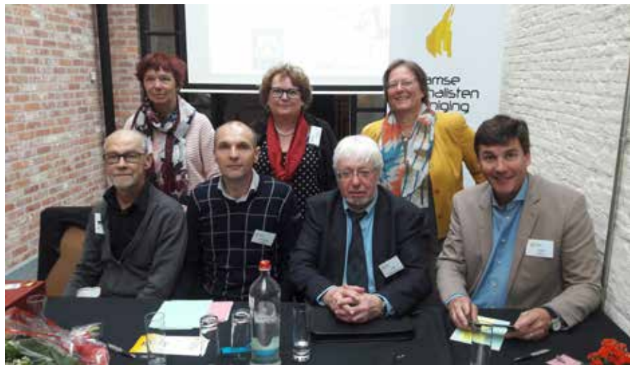
De Raad van Bestuur.