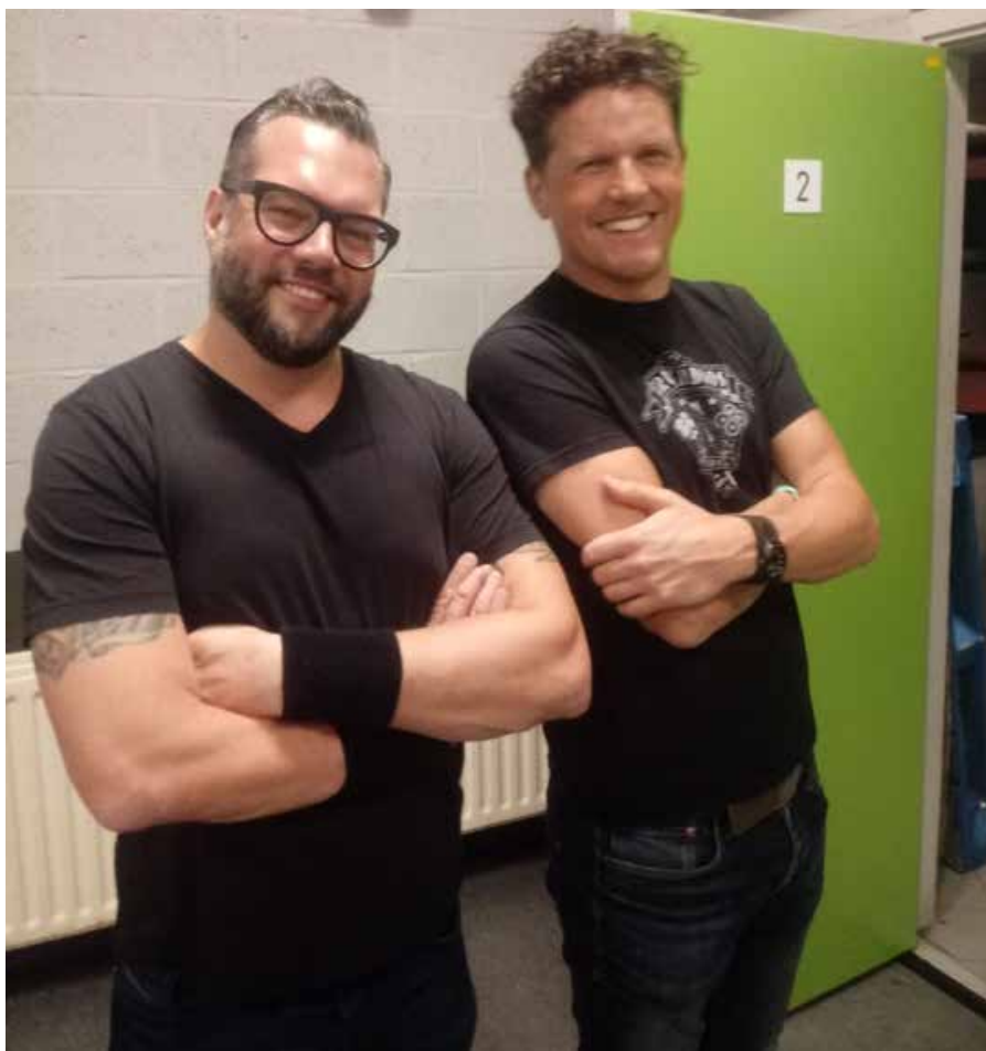
“De leukste terreuraanval ooit”

Voor de studenten had de Antwerpse politie een speciaal platform voorzien, dat een simulatie van Twitter voorstelde, zodat ze tweets konden bijhouden van onder andere de politie zelf en de zogenaamde politici. Ook de aanwezigheid van buitenlands pers werd in het scenario ingecalculeerd: een aantal studenten moesten fungeren als reporter van de BBC, het Amerikaanse CNN en het Franstalige Le Soir. Hun verslaggeving moest ook in het Engels of het Frans gedaan worden. Er was ook een website voorzien waar de studenten hun artikels en beelden konden posten.