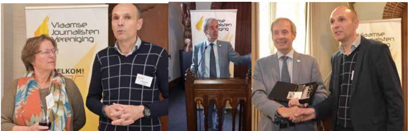
Na de Algemene Vergadering werd de VJV hartelijk ontvangen op het Stadhuis van Sint-Niklaas door burgemeester Lieven Dehandschutter.