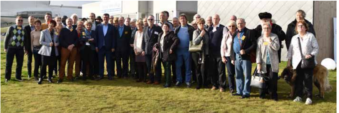
Groepsfoto met kersvers burgemeester Bart Tommelein en exclusief bezoek aan de luchthaven (onder).

in ons land geldt, moesten er eerst heel wat veiligheidsprocedures doorlopen worden, wat toch wel wat tijd in beslag nam. Maar wat onze leden daarna konden beleven, maakte dit ruimschoots goed: na een rondrit over de tarmac met een bus, kregen zij een indrukwekkende demonstratie van de brandweer. Zij mochten zelfs plaatsnemen in een reusachtige ‘crash tender’ (bluswagen), waarmee zij rondjes reden rond de vliegtuigen!