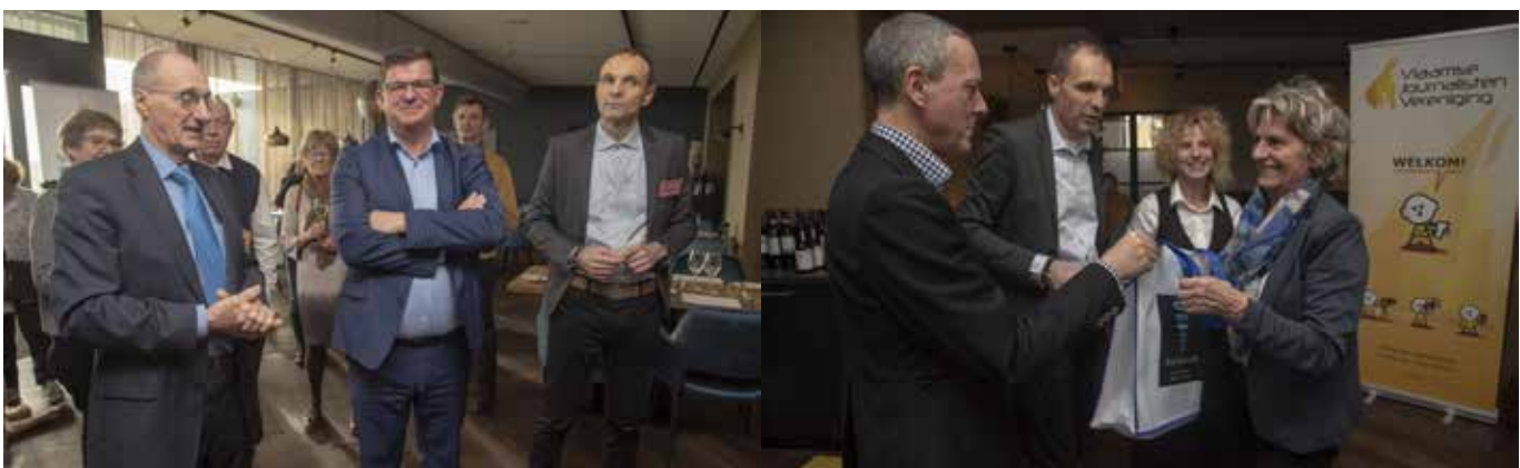
Onverwacht bezoek van Bart Tommelein tijdens de netwerkreceptie (links) en overhandigen van de 'goodie bags'.

En dan was het tijd voor het exclusief bezoek aan de luchthaven. Wegens de verhoogde staat van veiligheid die nog altijd