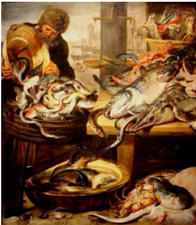
Frans Snijders, (1579-1657), Vismarkt in Antwerpen, Snijders&Rockoxhuis Antwerpen inv.77.148, Neerkamer, Kamer, 8

Op veertienjarige ouderdom ging hij 'in de leer' bij Pieter Brueghel II en later bij Hendrick van Balen, die ook de leermeester van Antony Van Dyck zou worden. In 1602 wordt hij vrijmeester in de Sint-Lucas gilde. Hij ontmoet Jan Brueghel I (ook de Fluwelen Brueghel genoemd en broer van Pieter Brueghel II). Jan wordt niet alleen zijn vriend, hij wordt ook Frans' mentor. In het najaar van 1608 reist Frans naar Italië.