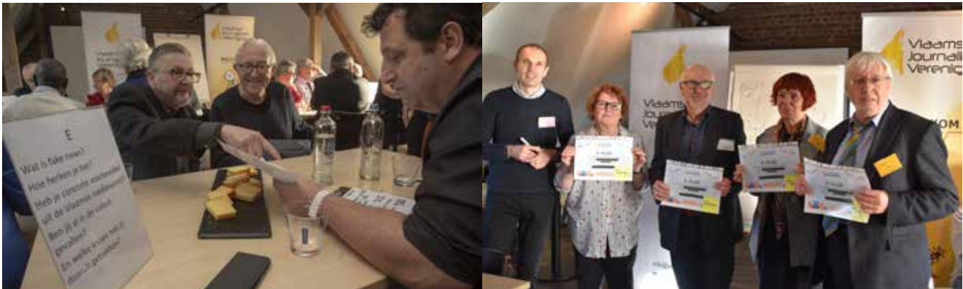
Tijdens het VJV-café wordt productief vergaderd (links) en de cadeaubonnen vanuit de ledenactie worden symbolisch uitgereikt.