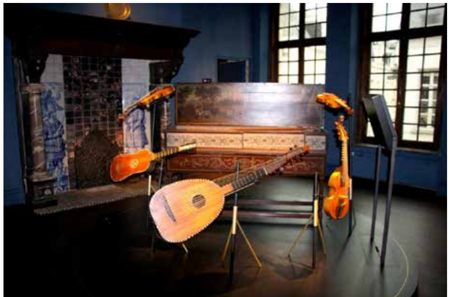
Cleyn Salet – Snijders&Rockoxhuis, sfeerbeeld, Kamer 1