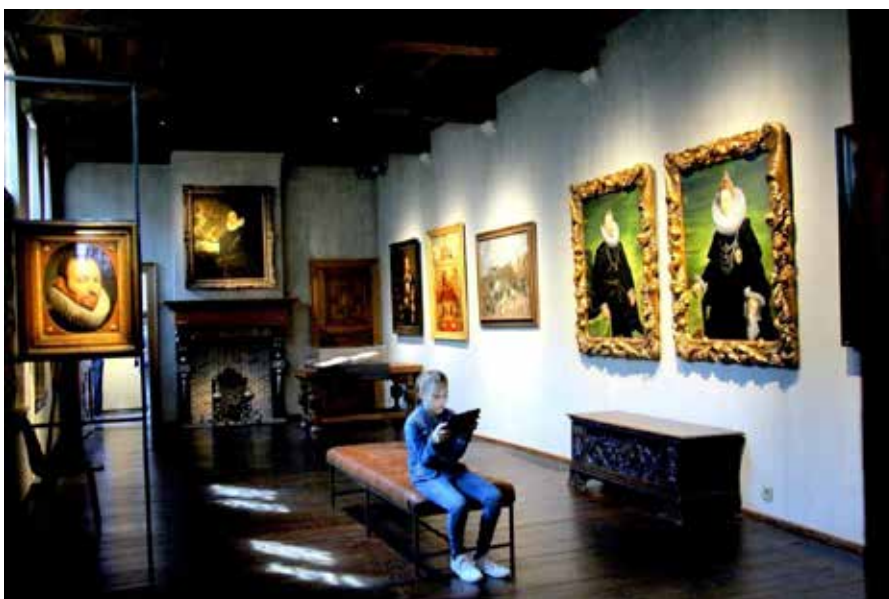
Cleyn Salet – Snijders&Rockoxhuis, sfeerbeeld, Kamer 1, foto Ch. Jennis.

Rockoxhuis maar was door de Kredietbank voorbehouden als opleidingscentrum. In juli 2017 sloot het Rockoxhuis voor renovatie- en uitbreidingswerken met het aansluitend Snijdershuis. Op 24 februari 2018 was het zover. 170 schilderijen van bekende 16de en 17de eeuwse, meestal Vlaamse, meesters werden tentoongesteld in tien zalen tezamen met een groot aantal kunstobjecten, meubels, wonderkasten en muziekinstrumenten. Het maakt van het Rockoxhuis een verrassend museum in hartje Antwerpen: het Snijders&Rockoxhuis