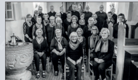
Skals Kirkes Voksenkor