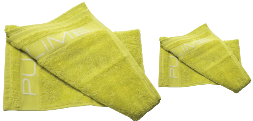
grote en kleine handdoek