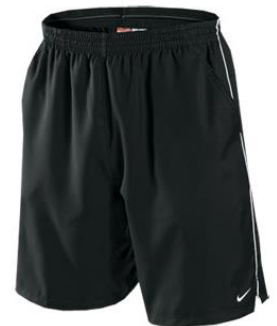
voetbalshirt en short