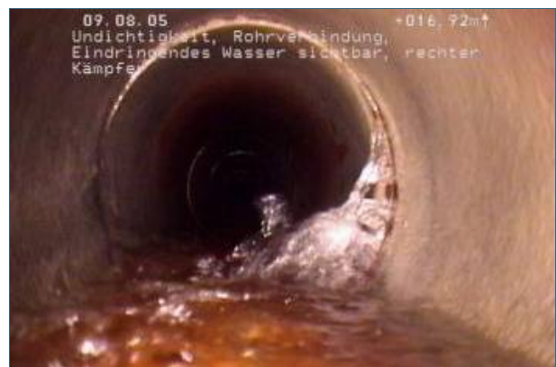
Abb. 4: Wenn aber Grundwasser in die Leitung eindringt, muss schnell gehandelt werden. Hier ist die Sanierungspriorität sehr hoch.