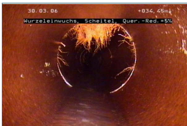
Abb. 3: Wurzeln, die in die Abwasserleitung einwachsen, müssen entfernt werden, sonst verstopft die Leitung. In diesem Beispiel ist die Sanierungspriorität mittel bis hoch.

Das Prüfprotokoll mit allen Anlagen gehört zu den Hausakten. Außerdem sollte das Prüfergebnis der Kommune mitgeteilt werden, auch wenn keine Schäden festgestellt wurden.