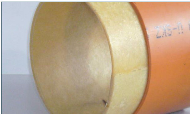
Abb. 5: Egal, ob ein kleiner Schaden mit einem Kurzliner oder die ganze Leitung mit einem Schlauchliner saniert wird, es entsteht immer ein (neues) Rohr im (alten) Rohr.

Beim Schlauchlining wird ein Schlauch aus Glasfasergewebe oder Nadelfilz in die defekte Leitung eingezogen. Der harzgetränkte Schlauch kann über Revisionsschächte, Fallrohre oder den öffentlichen Kanal eingebracht werden. Wenn der Schlauch an der richtigen Position ist, wird er an die Rohrwand gepresst und mit Hilfe von Warmwasser, Dampf oder UV-Licht ausgehärtet.