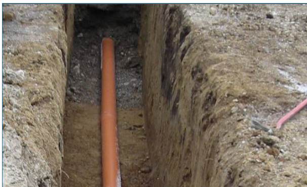
Abb. 6: Wenn eine Abwasserleitung erneuert werden muss, ist es sinnvoll, sie möglichst gerade zu verlegen. So kann sie in Zukunft leichter geprüft werden.

Beim Berstlining entsteht ein neuer Kanal in der alten Trasse. Dazu wird ein kegelförmiger Berstkopf an einem Seil durch den defekten Kanal gezogen. Dabei zertrümmert er das alte Rohr und verdrängt die Bruchstücke in das umgebende Erdreich. Das neue Kanalrohr wird hinter dem Berstkopf eingezogen.