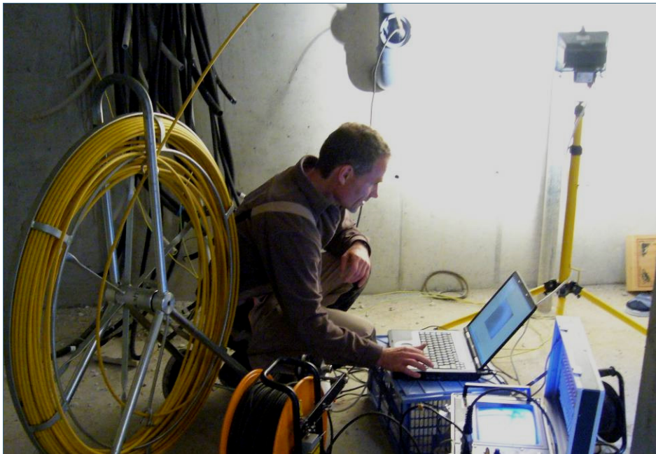
Abb. 2: Ohne Baustelle und Dreck wird bei einer optischen Inspektion die Kamera zum Beispiel über eine Revisionsöffnung im Keller in die Abwasserleitung geschoben.

In der Regel reicht die optische Inspektion aus, auch wenn die Kameras kleinere Schäden in den Rohrverbindungen „übersehen“ können.