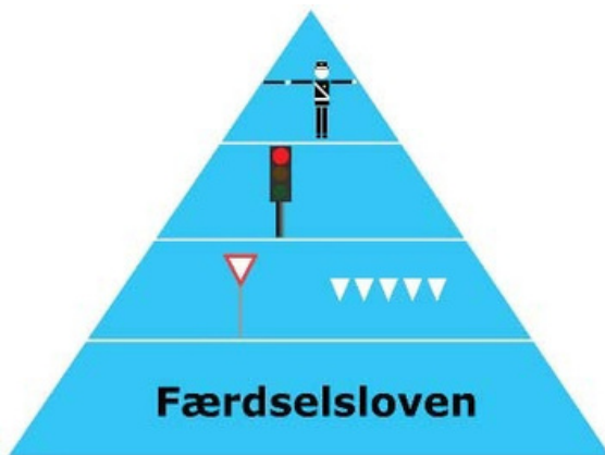
Vigepligts hiraki. Den øverste i pyramiden er vigtigst.

Generelt Enhver frivillig hensættelse af køretøjet - Husk: Du har ikke overholdt din vigepligt, hvis du har jet i mindre end 3 min. med eller uden været til ulempe. Dvs. når du kommer ud på vejen, skal fører. Standsning er også ind- og ud- du op i fart uden at blive indhentet. stigning, af- og pålæsning af varer og gods uanset varighed.