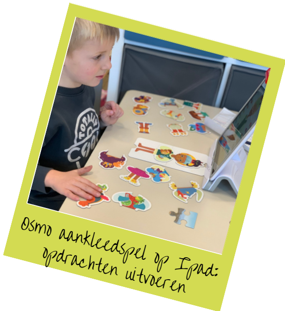
Osmo aankleedspel op Ipad: opdrachten uitvoeren