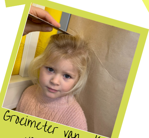
Groeimeter van K2 van nov-juni