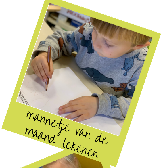
mannetje van de maand tekenen