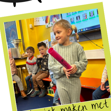
Muziek maken met de boomwhackers