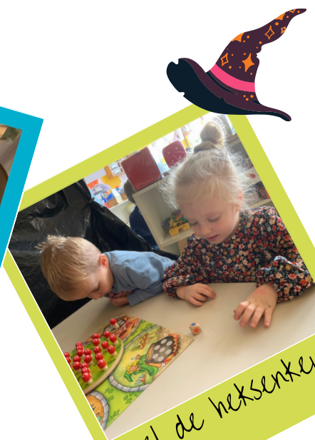
Spel de heksenkeuken