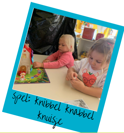
Spel: knibbel knabbel knuisje