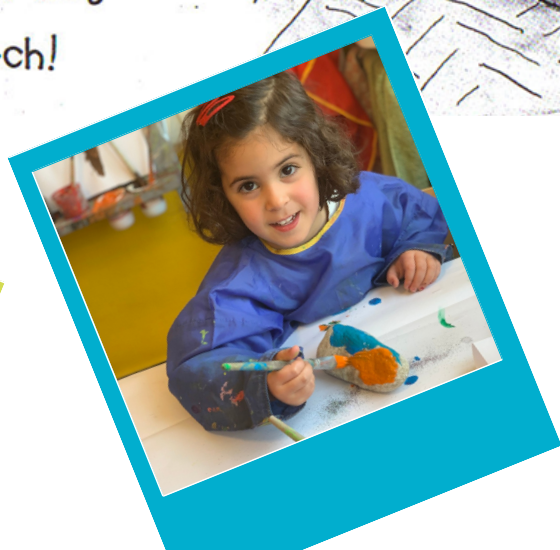
Toverspreuk: Lip lap lens