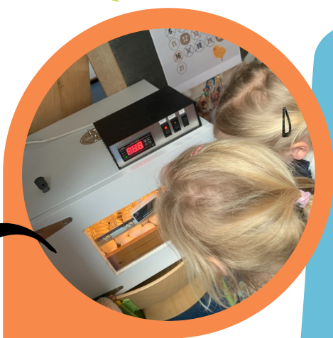
Broedmachine met eitjes