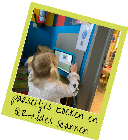
paaseitjes zoeken en QR-codes scannen