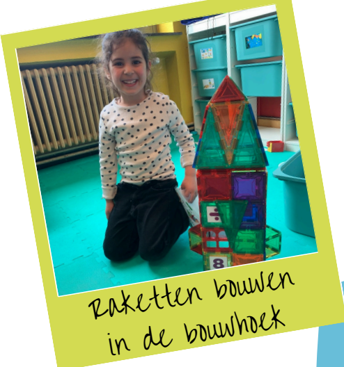
Raketten bouwen in de bouwhoek