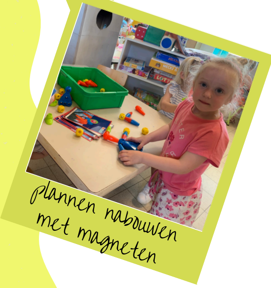
plannen nabouwen met magneten