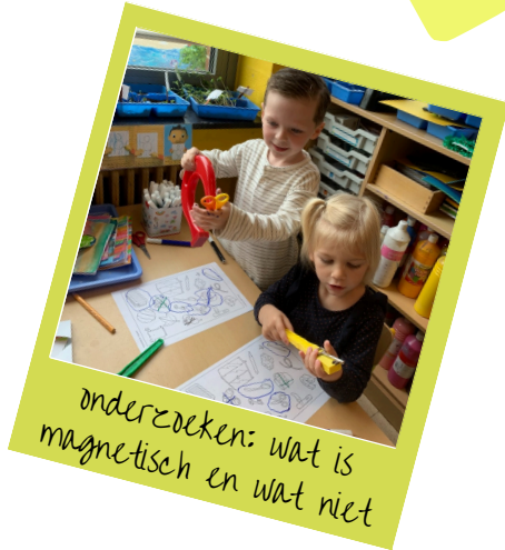
Onderzoeken: wat is magnetisch en wat niet

We hadden allerlei nieuw spelmateriaal in de hoeken, experimenteerden met magneten, knutselden raketten, ... Tevens waren we heel veel met wiskunde bezig.