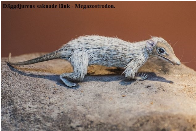
Däggjurens saknade länk - Megazostrodon.

Alla fossil, av de organismer som existerat, hittas inte. Det gör att det inte alltid går att följa en tydlig utveckling. Till exempel har inte ett fossil hittats, som ger en tydlig koppling mellan människans urfader och apornas. Det vill säga; det djur som var deras gemensamma urfader. Denna förmodade varelse kallas "den felade länken (missing links)". Det finns otaliga saknade urfäder mellan andra djur som tros vara släkt. Det finns också djur som har drag från olika djurgrupper till exempel näbbdjuret som är ett äggläggande däggdjur med näbb och päls. Teorin om den felade länken är omodern och används inte längre inom vetenskapen.