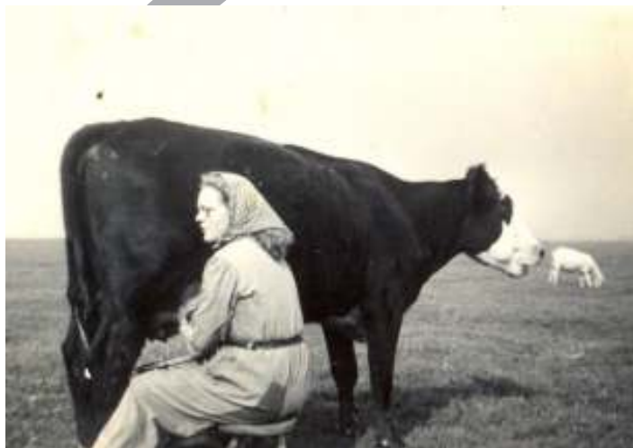
Koemelkster met blaarkop, ergens in Adorp

eeuw vrouwen onder druk van het zogenaamde Burgerlijk Beschavingsoffensief en het 'mannelijk kostwinners-ideaal' langzaam uit het arbeidsproces gedrukt werden. Mede daardoor ontstond vervolgens de neiging om minder vaak een vrouwenberoep te noteren, hoewel vrouwen vaak wel degelijk enige economische arbeid verrichtten.