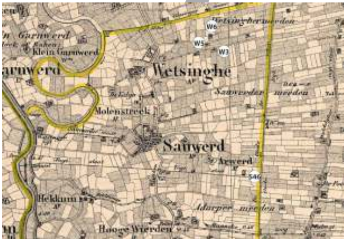
Kaart omgeving Sauwerd, rond 1850.