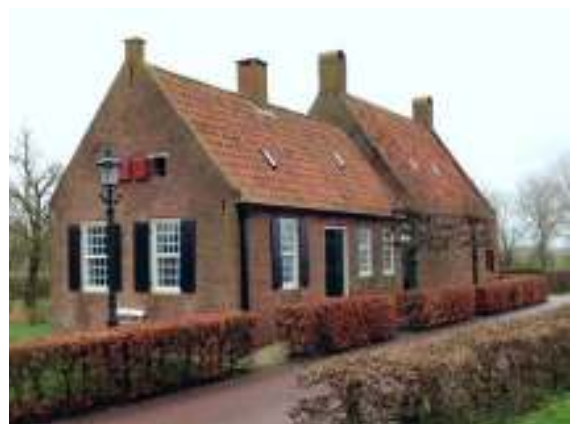
De nieuwe kosterij anno 2020. Het huis is deels gebouwd van oude bouwmaterialen afkomstig van het gesloopte schooltje annex kosterij, dat eerder op deze plek stond.