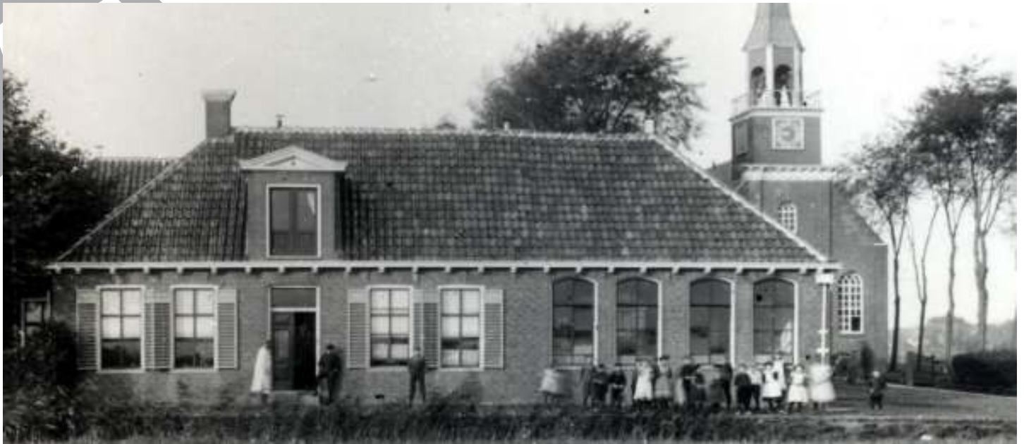
Dit is de nieuwe school die in 1844 in Klein Wetsinge werd gebouwd als vervanging van het oude schooltje in Groot Wetsinge én van de oude school in Sauwerd aan de Oude Kerkstraat. Links is de woning van de schoolmeester en rechts zijn de klaslokalen.

Opgave van wat verbeterd of aangeschaft moet worden met betrekking tot: