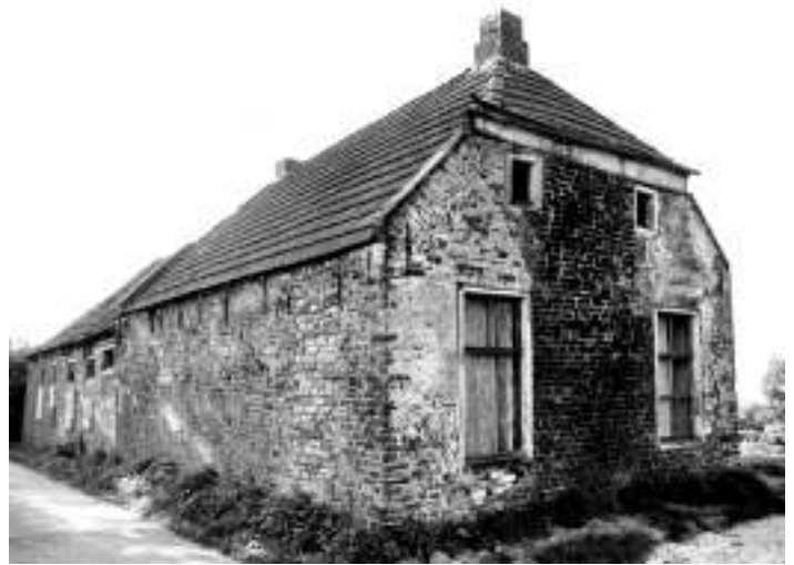
De voorzijde van het oude schooltje annex kosterij in 1972. Hier woonde eeuwenlang de schoolmeester van Groot Wetsinge met zijn gezin. Linksachter zien we het deel waarin het schooltje gevestigd was.

Beide gebouwen zijn aan elkaar verbonden door een klein schuurtje, dat tussen het woongedeelte van de kosterij en de school in zit. De school bevindt zich aan de westzijde van het gebouw. Deze is voorzien van een stenen vloer en vijf glasramen. Vier van deze ramen, waarvan zich twee in de zuid- en twee in de westmuur bevinden, hebben een hoogte van 92 cm en een breedte 45 cm. Het vijfde venster is van lood en is 1,10 m hoog en 45 cm breed. Verder bevinden zich in dit schoolvertrek twee deuren, waarvan de deur in de zuidmuur in de buitenlucht uitkomt. De andere deur geeft toegang tot de schuur. Beide deuren staan schuin tegenover elkaar en dat veroorzaakt hevige tocht. Dit wordt nog versterkt doordat een van beide deuren meestal 's winters opengezet moet worden om het roken van de kachel te beperken. Aan vrije lucht is er zodoende geen gebrek. Het licht is voldoende. Voor het aantal kinderen is de schoolruimte veel te klein.