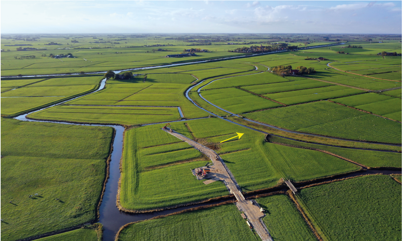
Afb. 5. Drone foto van de bouw-weg en de boerderijplaats (pijl). Linksboven de Margriethoeve en de Wetsingerzijl.