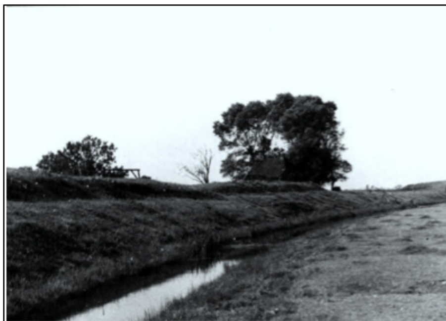
Afb. 4 Net achter de Oude Dijk langs het Oude Diepje (de voormalige Hunzemeander) is het dak van de boerderij te zien.