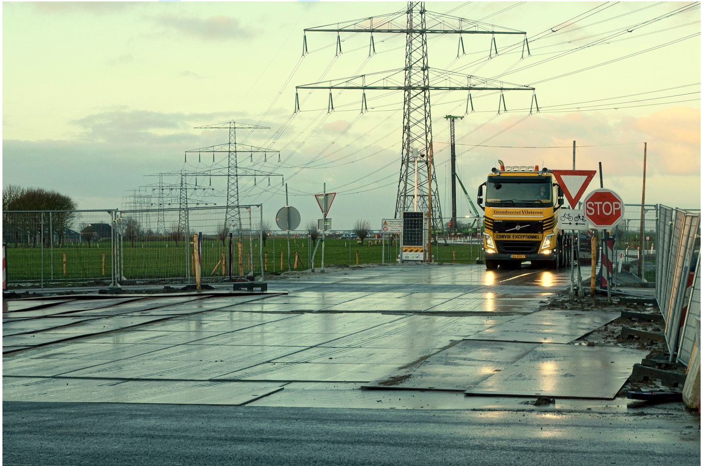
Afb. 2. Bouwweg van betonnen platen met hier extra stalen rijplaten, vanaf de Provincialeweg even ten noorden van Sauwerd richting het Reitdiep, t.b.v. de nieuwe mastlocaties. Vlak naast de bestaande vakwerkmast (dit is vertekend, in werkelijkheid naast de tweede mast op de foto) staat de stelling voor het boren van de stalen funderingspalen (achter boerderij Derksen).