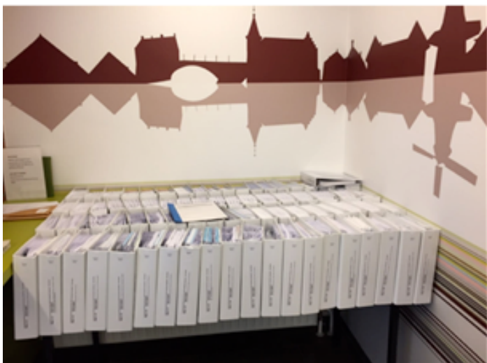
Afb. 5. De ter visie liggende stukken behorende bij de vergunningaanvraag bij de gemeente Winsum.

het aannemen van deze motie was echter dat van ondergrondse aanleg geen sprake meer kon zijn. De gedeputeerde en de wethouders legden zich hierbij neer, waarschijnlijk eerder al onder druk van het ministerie van EZ en met de toegezegde ruimhartige compensatie van EZ van plm. 19 miljoen euro, waarbij nog een significant deel door de Provincie zelf moest worden opgebracht. Deze 'draai' leidde tot een breuk in de samenwerking tussen de koepel NMFG en genoemde bestuurders.