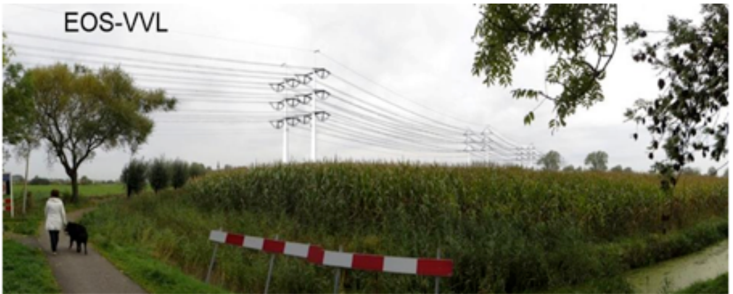
Afb. 3. Impressie van de nieuwe 380 kV hoogspanningslijn, gezien vanuit Sauwerd met links de Valgeweg richting Klein Wetsinge. Rechts de sloot naast het paadje achter de Noorderweg, de Merenweg. Ten tijde van de foto stond er mais op het land naast de sloot, nu is het grasland. Opm. De elektriciteitskabels zullen voorlopig alleen tussen de beide buismasten worden opgehangen. De hier afgebeelde situatie is de eindfase.

toepassing van deze wet kunnen grote infrastructurele projecten zonder lange vergunnings- en inspraakprocedures betrekkelijk snel tot uitvoering komen. Dat was, zo vlak na de Tweede Wereldoorlog, ook wel nodig. Nederland lag grotendeels in puin en er moest snel aangepakt worden. In het geval van de nieuwe 380 kV hoogspanningslijn heeft het ministerie van EZ handig gebruik gemaakt van deze wet. De Provincie Groningen speelde hierin geen beslissingsrol, alleen een coördinerende. De gemeentebesturen konden slechts de vergunningen afgeven voor de bouw van het gedeelte van het traject in hun gemeente. Bij veel gemeenten ontbrak daardoor het overzicht en de impact van het hele project en was men aanvankelijk geneigd gewoon de vergunning te verlenen.