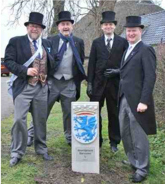
Kapittelheren bij het plaatsen van de grensstenen van de heerlijkheid Harssens in 2013

Om zijn heerlijke rechten veilig te stellen richtte de in 2017 overleden Stienstra in 2012 twee stichtingen op. De Stichting Heerlijkheid Harssens en de Stichting Harssens . Eerst genoemde stichting heeft als doel de instandhouding van de Heerlijkheid Harssens en het verrichten van al hetgeen daartoe bevorderlijk kan zijn, alles in de meest ruime zin van het woord. Deze stichting organiseert eens in de twee jaar een landdag, een feestelijke bijeenkomst met een historische accent, altijd in relatie tot de geschiedenis van Harssens.