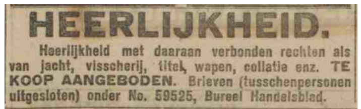
Advertentie 'Heerlijkheid te koop', Handelsblad in 1917