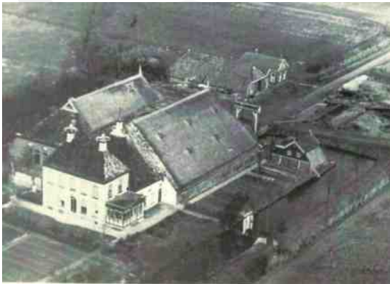
Boerderij Dinghweer bij Lellens omstreeks 1950.

Deze man zei: "Ik breng jullie wel naar Ten Post met de groentekar." De kinderen gingen plat in zijn groentekar liggen. Daar werden groentekistjes schuin overheen geplaatst met een kleed erover en met een paard ervoor. Moeder kreeg mannenkleden aan en een pet op en ging naast de man op het bankje zitten. Zo zijn ze naar Ten Post gereden.