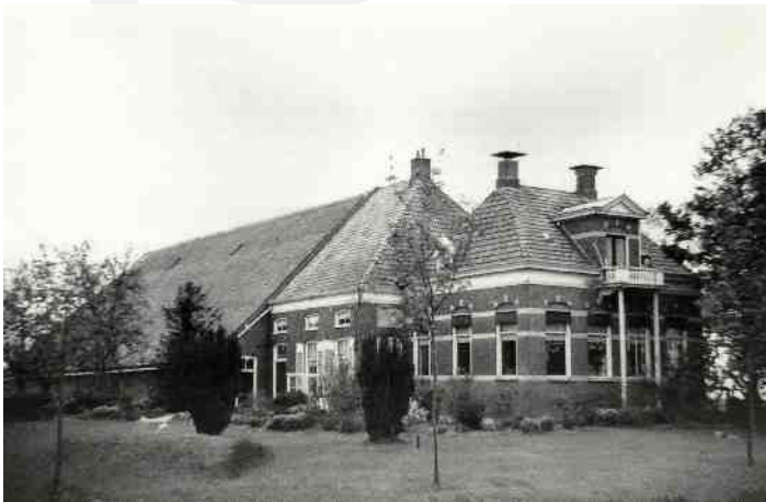
De boerderij van de familie Veldman op Heksum, gezien vanuit het zuidoosten.

In 1943 is er huiszoeking geweest op de boerderij. De Duitsers dwongen Freerk (toen 9 jaar) hen naar zijn vader te brengen. Meindert werd ruw ondervraagd, maar bleef rustig. Ondertussen haalden de Duitsers alles overhoop maar konden niets verdachts vinden. Meindert was boos over zoveel rommel en eiste excuses. Die kreeg hij schoorvoetend, maar hij bleef verdacht. Ze hebben vreselijk geluk gehad want in de schuur, in een donkere hoek naast wat gereedschap en werktuigen, stond een kist met verboden spullen, pamfletten, geweren, munitie en radio's, die Meindert juist in het hooi wilde verstoppen. De Duitsers hebben de kist niet opgemerkt. De onderduikers op Heksum konden ontsnappen, want postbode Dijksterhuis, die ook de telefooncentrale beheerde, had gehoord dat deze overval op handen was en kon de mensen op Heksum tijdig waarschuwen.