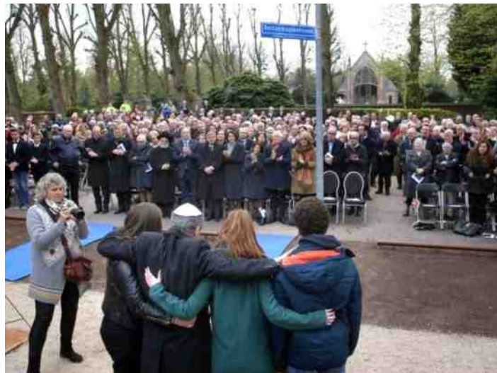
Plechtigheid in Reitsemaplantsoen, Laren, 2017

De werkgroepen Westerdijkshorn, Sauwerd-Wetsinge en Erik de Waal van Natuur en Milieufederaties zien nog altijd mogelijkheden dat de RvS het 380 kV-plan op onderdelen zal kunnen tegenhouden.