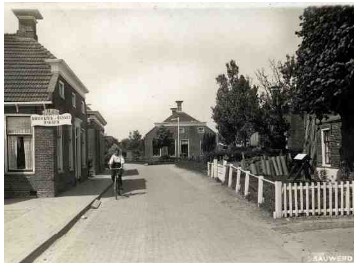
De bakkerij van Zwartenkot in de Kerkstraat

Duitse soldaten die ingekwartierd waren in Sauwerd kwamen wel eens voor een broodje of een gebakje in de winkel van Zwartenkot.