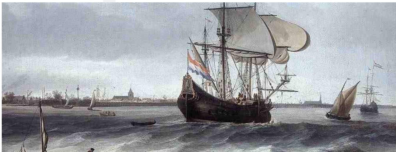
Afb. 2 Fluitschip uit de 17de eeuw. Vanuit Amsterdam, Hoorn en Harlingen voeren jaarlijks honderden "Fluyten" via de Sont naar de havens van de Oostzee. Heeft de familie

Römelingh zó de reis vanuit Denemarken naar Amsterdam gemaakt? Schilderij van J. Th. Blanckerhoff, collectie van het Nederlands Scheepvaartmuseum te Amsterdam.