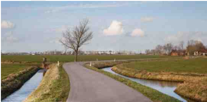
Afb. 1 De knik in de Karspelweg achter Wetsinge.