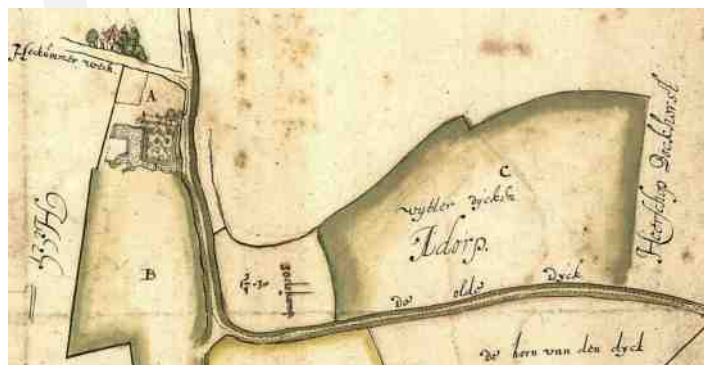
Afb. 3. De omgeving van Hekum op de kaart van Haubois van 1641. Het noorden is beneden.

Even voorbij de boerderij de Raken gaan we dwars door