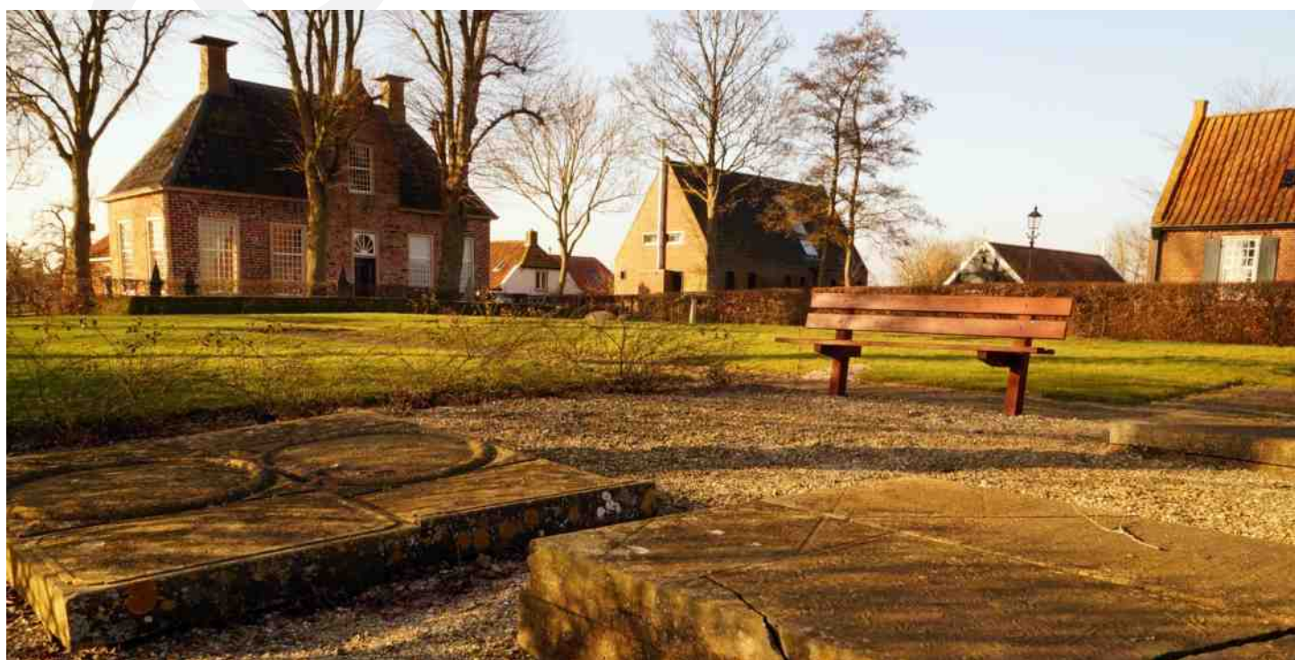
Afb. 4 Kerkhof van Wetsinge.

- Harry Brouwer: Een grote hoop verrot holt en dog weijnig beenderen – Grafkelders in het Groningerland . Deel 18 uit de reeks Kerken en kerkhoven van de Stichting Groninger Kerken. (2016)