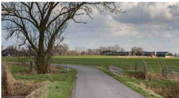
Afb. 5. De knik in de weg bij de Eenstermaar. Op de achtergrond de Hoge Wier.

Als we de oude bedding zijn gepasseerd (na de tweede knik), ligt het grasland rechts wat hoger. Dit perceel ligt op de oeverwal van de oude meander. Langs de slootranden slingeren stukken baksteen en kogelpotscherven. Hier heeft ooit een dorpje gelegen. Miedema herkende hier een zestal boerderijplaatsen. Ook deze werden rond 800 bewoond en omstreeks 1400 verlaten. Het waren echter geen verhoogde huiswierden zoals bij de driesprong in Heksum. Omdat de locatie van nature al verhoogd was, ging men hier direct op het maaiveld wonen. Miedema heeft hier tijdens haar onderzoek honderden potscherven opgeraapt. Allemaal van handgevormde kogelpotten.