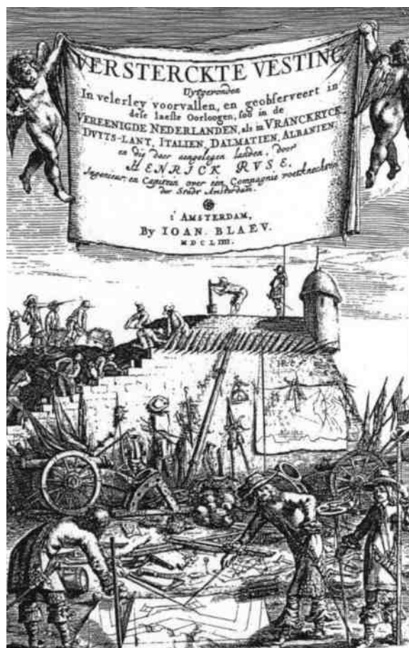
Afb. 3 Titelpagina van "Henrik Ruse's Versterckte Vesting", Amsterdam, 1654.

Omstreeks 1650, na elf jaar buitenland, besloot Ruse terug te keren naar zijn vaderland om ouders en vrienden te bezoeken. Hij reisde via Duitsland en maakte onderweg nogmaals een grondige studie van de vestingwerken waar hij langs kwam.