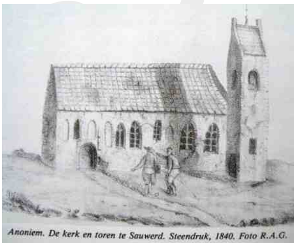
Afb.1 Het middeleeuwse kerkje van Sauwerd. Steendruk uit 1840.