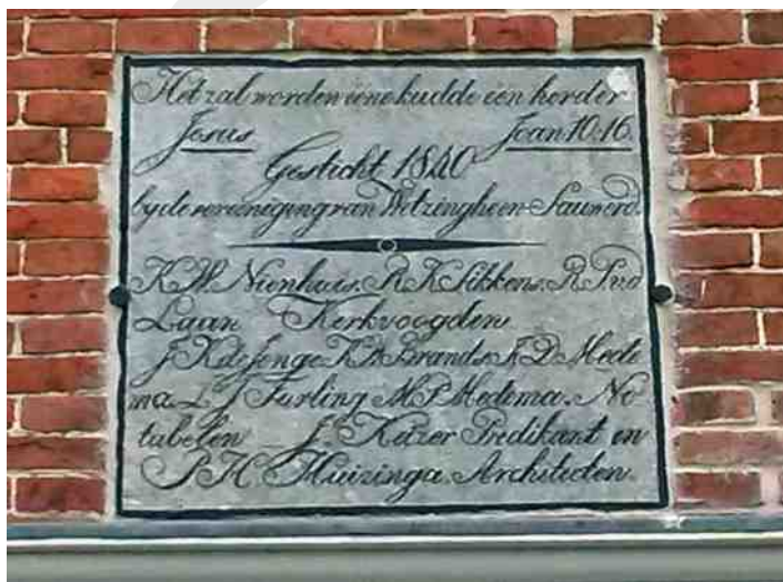
Afb. 4 Gevelsteen kerk van Wetsinge