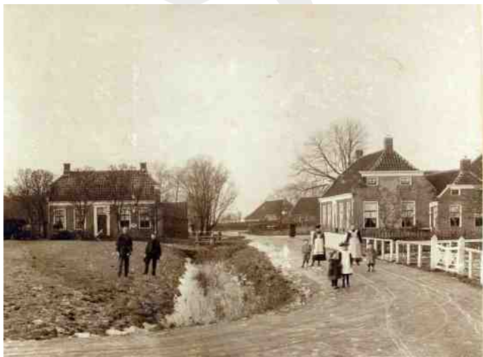
Afb. 2 Het huis aan de rechterkant is Burchtweg 5 (Zie Tussen Toen en Nu , p.146)

stelde Nijmeegse geliefde. De kerkelijke inzegening zal in het middeleeuwse kerkje aan het Hoogpad geweest zijn. Het jonge paar gaat wonen in huis no. 31 (Kerkstraat, recht tegenover de Schoolstraat) in Sauwerd. Zeven maanden later, in januari 1835, wordt daar hun eerste kind geboren, een zoon die de namen Pieter Claude krijgt, naar zijn beide grootvaders. Het jongetje sterft echter al na een jaar. Als op 2 mei 1837 opnieuw een zoon geboren wordt (in huis 28, nu: Burchtweg 5) (afb. 2) krijgt hij de naam van zijn gestorven broertje. Hij is de pasgeborene uit het doopboek van Sauwerd, waarmee dit artikel begon.