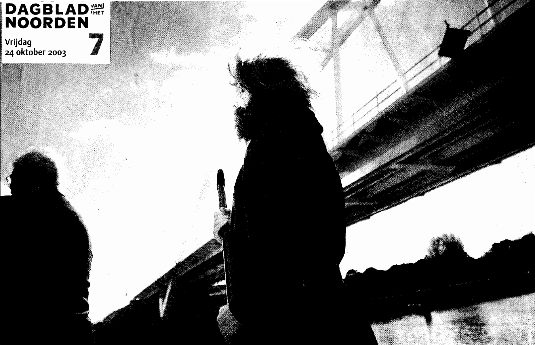
'Walfridus' bij de officiële opening van de nieuwe spoorbrug over het Van Starckenborghkanaal.