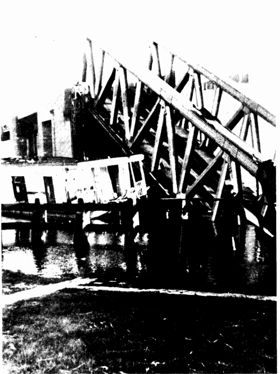
Groningen. De opgeblazen spoorbrug over het van Starckenborghkanaal met een woonboot die eerst door de Duitsers was gebruikt als onderdak van de wacht bij de Bedumerbrug en later als veerpont voor de Canadezen, die over het kanaal gingen om de Duitsers uit Noorderhogebrug te verdrijven.