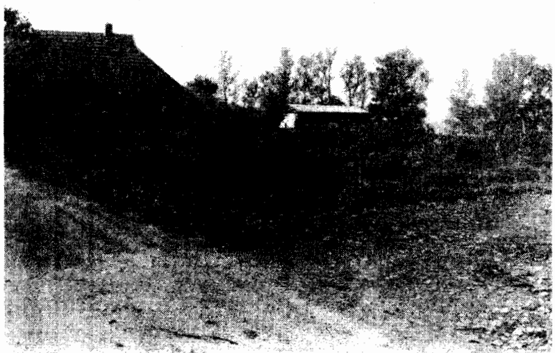
Op dit terrein zal de kosterij herbouwd moeten worden.

De burgemeester doelt daarbij op het feit dat de wierde door CRM, op aandrang van de Rijksdienst voor Monumentenzorg, is verklaard tot archeologisch monument. „Dat betekent dat op die plaats alleen de kosterij mag worden herbouwd, die daar heeft gestaan. En wij pikeren