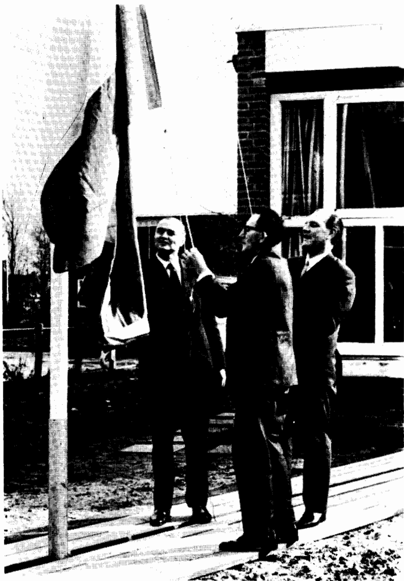
Officiële opening „Ubbegaheem” 31 maart 1967