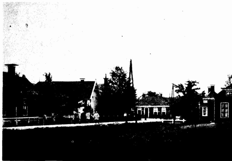
De Winsumerstraatweg omstreeks 1925