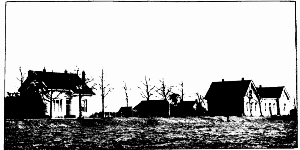
Het station van Sauwerd. Hoe lang nog dit beeld?

reizen niet in Sauwerd, doch in Groningen te beginnen. werkte sterk nadelig op de inkomsten aan reizigersgeld op het Sauwerder station. Ook het selectieve autogebruik: voor reizen, die zeer goed per trein gemaakt kun-