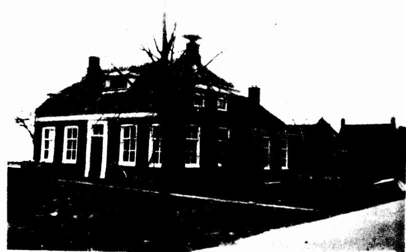
— Voor de afbraak —

stuur raakte hierdoor in een moeilijke situatie, doch men liet de zaak aanvankelijk rusten. Doch in december 1965, toen de beslissing over de terreinkeuze uiterst dringend werd, verklaarde mevr. Rosema zich toch nog bereid om op de overeengekomen voorwaarden haar woning te verkopen. Daarmee was een hinderpaal, die een grote vertraging in de stichting van het dorpshuis had kunnen vormen, weggenomen. Het voorval heeft er wel toe bijgedragen dat bij het stichtingsbestuur de spanning er in bleef en de aandacht niet verslaptte. In dezelfde maand kwam ook nog de woning Burchtweg 10 van fam. wijlen Okke Medema te koop. Door bemiddeling van de heer F. Noordhuis werd dit perceel met 3 1/2 are grond gekocht voor f 4000,-. De mogelijkheden op het bouwterrein werden daardoor aanzienlijk groter, met name ook voor eventuele toekomstige uitbreidingen. Omdat het voorlopige stichtingsbestuur handelend moest optreden, werd op 9 februari 1966 onder barre weersomstandigheden in café Barel's te Sauwerd voor Jhr. Mr. S.M.S. de Ranitz, notaris te Winsum, de stichtingsacte verleden. Er traden 20 leden, 19 verenigingen vertegenwoordigende, toe tot de stichting. Het voorlopige stichtingsbestuur werd het dagelijks bestuur van de stichting. Hierin waren inmiddels enkele mutaties gekomen: de heer T.J. Pool werd wegens vertrek naar Paterswolde vervangen door de heer J. Dijksterhuis, terwijl de heer A. Broekema wegens vertrek naar Win-