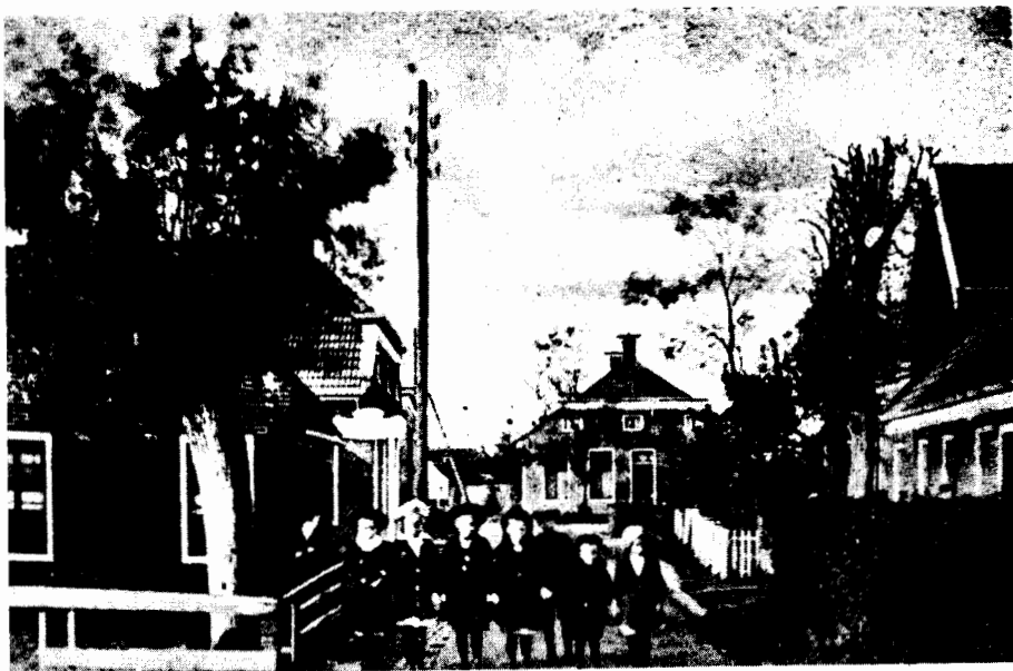
Kerkstraat omstreeks 1920, vóór de doorbraak van de prov. weg.