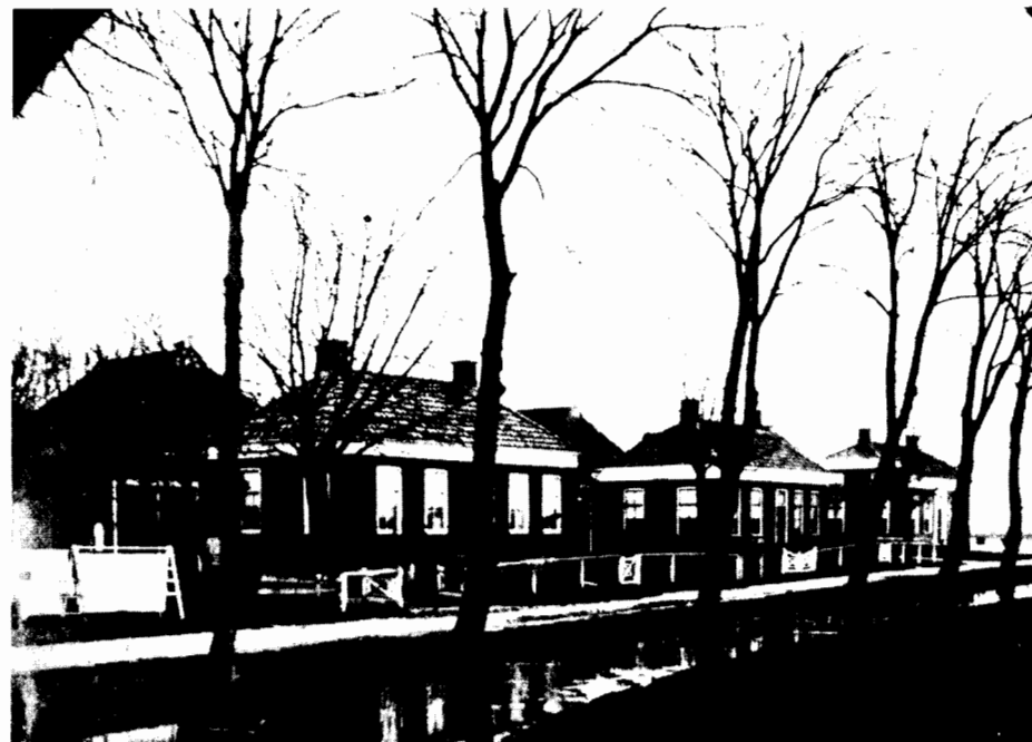
Terpstra's Laan (Oosterstraat) omstreeks 1910.

In deze jaren ontwikkelde het dorp Sauwerd zich goed. In 1900 was het in 1898 gebouwde huis Oude Winsumerstraatweg no. 1 (winkel Antuma) de enige woning oostelijk van de Oude Winsumerstraatweg-Plantsoenweg, op een paar woningen aan het begin van de Oosterstraat na. Het dorp ging in ontwikkeling Adorp flink voorbij.