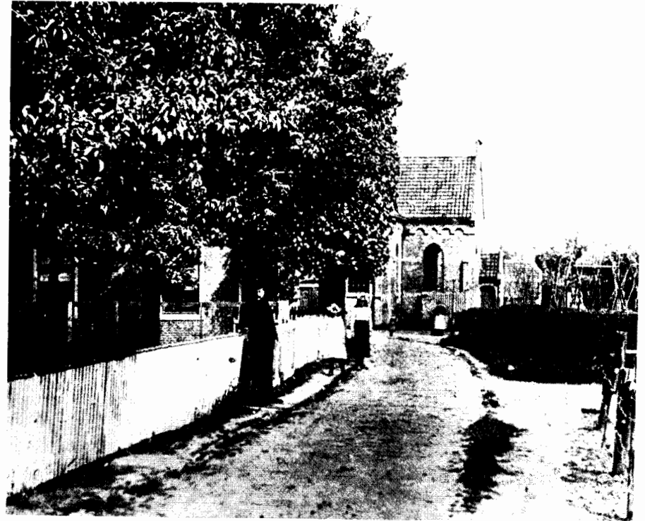
Oude Kerkstraat omstreeks 1915.