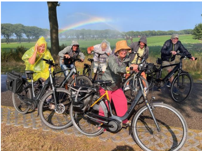
één van de opdrachten